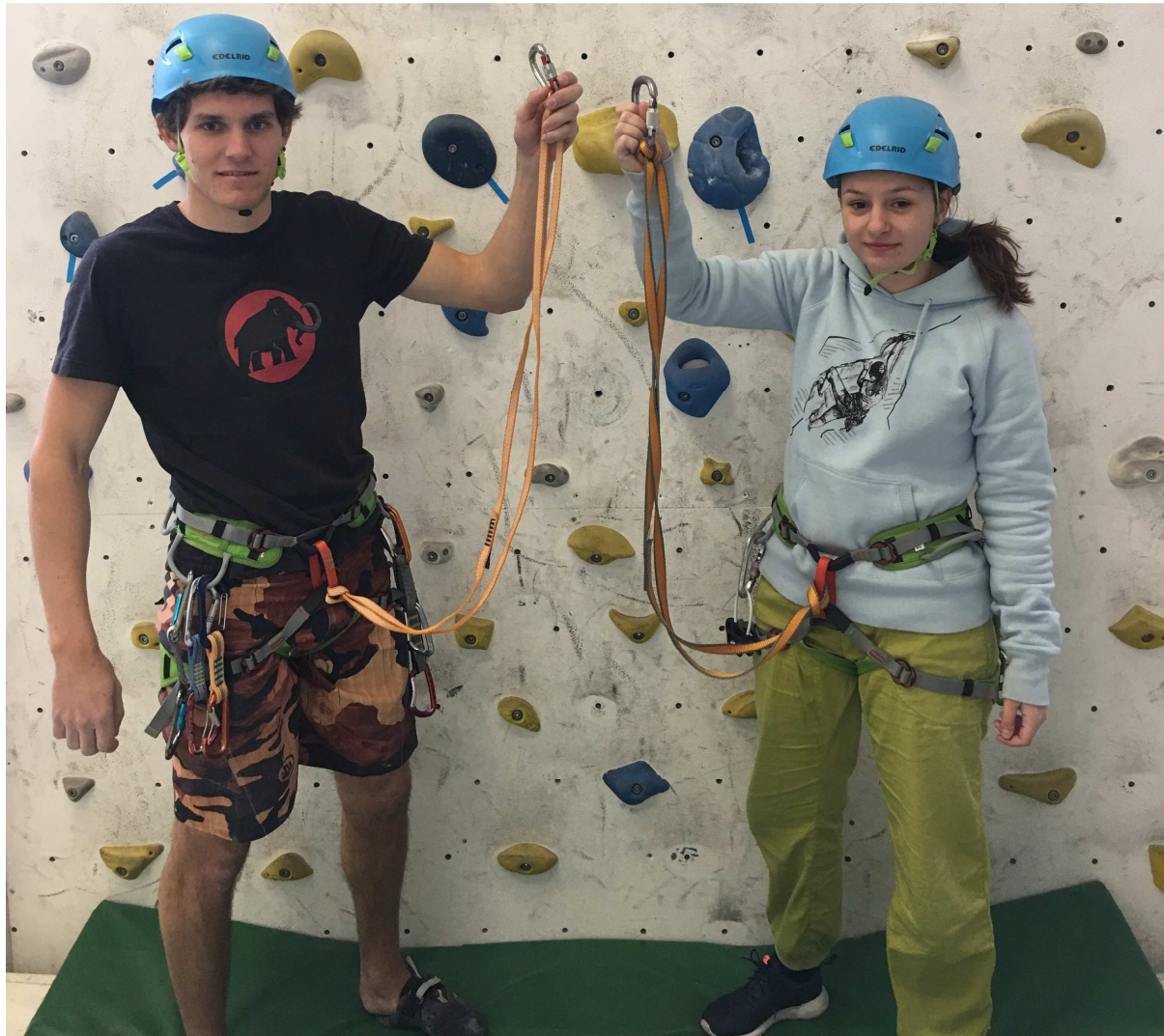
Slika 3: Pripravljene popkovini.