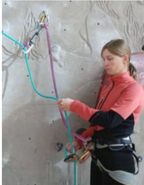
Slika 1: Varovalec je zavarovan s popkovino. Za učinkovito varovanje, plezalca varujemo preko kompleta, ki ga vpneemo v prvi svedrovec ali v vponko z matico na popkovini (Česen, 2016).

Kadar pa je vstop v smer na strmem in izpostavljenem terenu ali celo na skalni polici, govorimo o »nevarnem vstopu« . Na takšnem terenu pa moramo že na samem vstopu v smer poskrbeti za ustrezno zavarovanje.