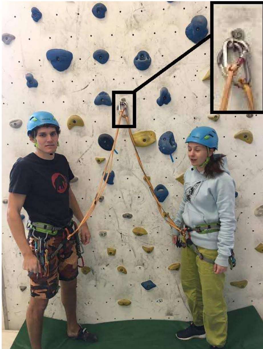
Slika 4: Vponki vpeti v svedrovec.