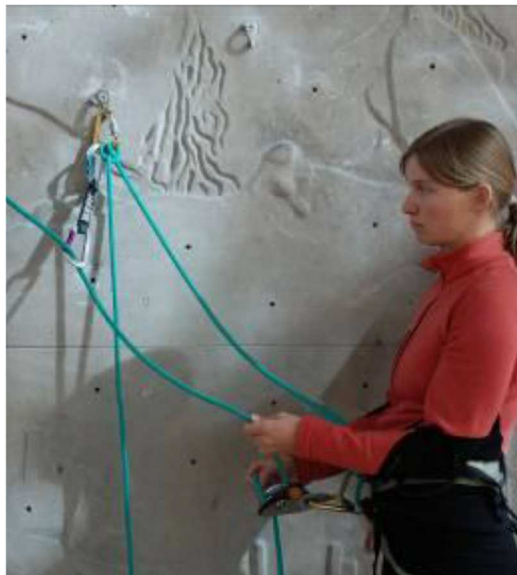
Slika 2: Varovalec je zavarovan z glavno vrvo. Navezan je na vrvi in z bičevim vozlom vpet v vponko z matico. Za učinkovito varovanje, plezalca varujemo preko kompleta, ki ga vpneemo v prvi svedrovec ali v vponko z matico na popkovini (Česen, 2016).

Zaradi raznolikosti »nevarnih vstopov« je takšen vrvi manever težko poučevati. Saj različno izpostavljena mesta zahtevajo različno obnašanje. Tako smo npr. na nekaterih manj