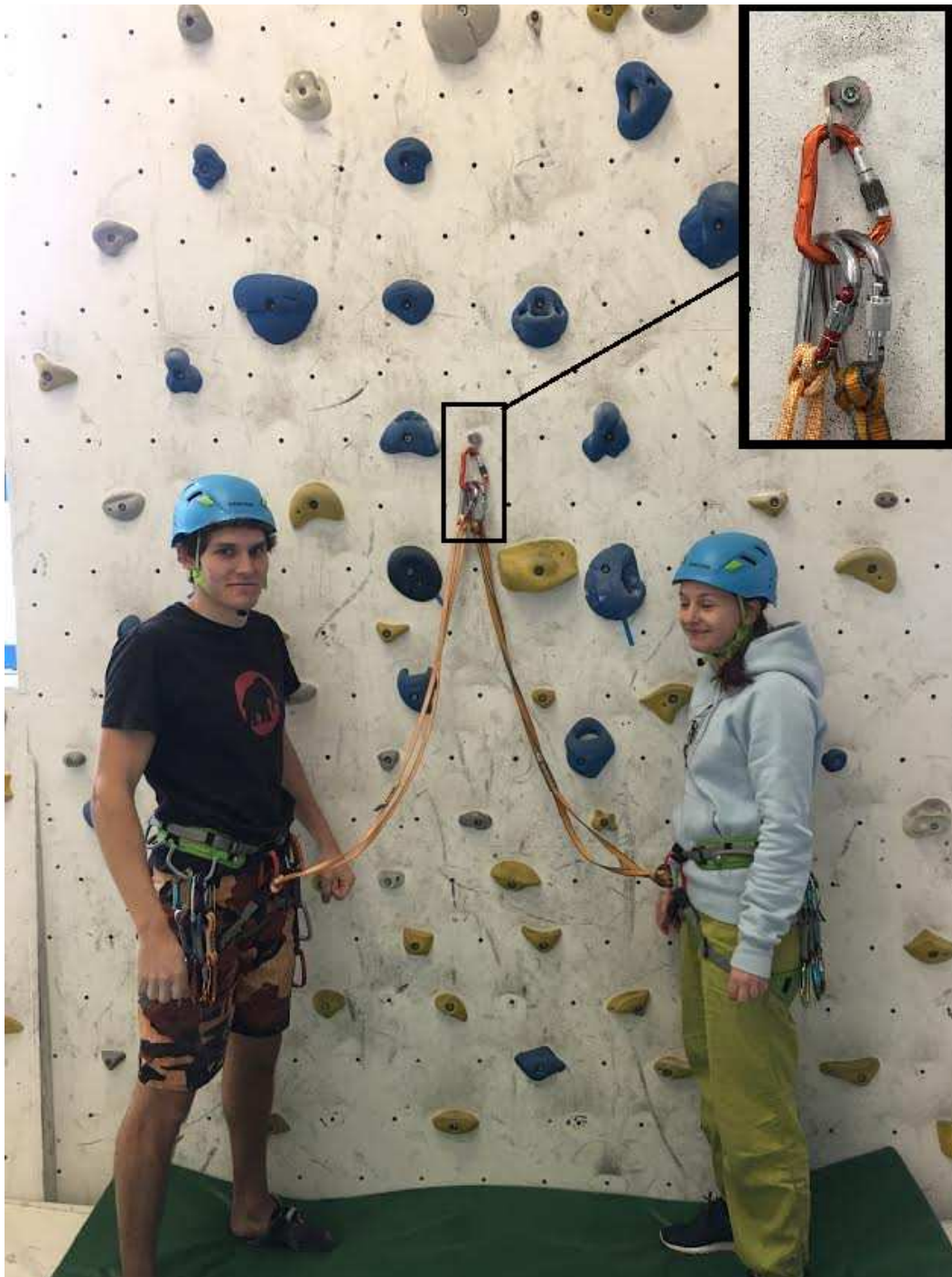
Slika 5: Vponki vpeti v dodatno vponko.