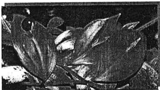
Širokolistna lobodika ( Ruscus hypoglossum )