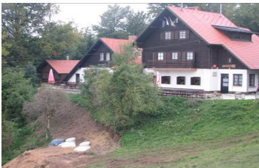
Vgradnja čistilne naprave

Že spomladi smo nameravali vgraditi čistilno napravo za čiščenje odpadnih vod iz koč. Pa se je zapletlo pri lastništvu zemljišča, saj je bilo zemljišče, ki je neposredno pod koč, v lasti Občine Krško, ne pa soseda, ki nam je dal ustno soglasje za vkop čistilne naprave. Po tej ugotovitvi smo občino zaprosili za služnost, za vkop čistilne naprave in sprožili postopek zamenjave zemljišča, po katerem teče cesta mimo koč proti Planini za zemljišče neposredno pod koč. Jeseni, po ureditvi vseh lastniških zapletov, smo vgradili čistilno napravo. Izvajalec del je bil Kostak Krško, investicijska vrednost pa je znašala več kot 20.000 EUR. Po zagonu čistilne naprave je bilo še nekaj težav, smrad iz odtočnih cevi v sanitarijah koč, zaustavitev delovanja ob izpadu elektrike, slaba slišnost alarma, ki opozarja na napako, in tudi omarica za upravljanje ni na ustrezni lokaciji. Ko bo skopnel sneg, nas čaka kar nekaj opravil, da ocenimo kvaliteto delovanja in odpravimo pomanjkljivosti.