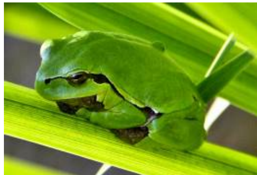
Naravovarstveni izlet MDO na Vetrnik, 2012