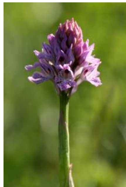
Kukavice na suhih travnikih na Bohorju

"Najlepši trenutek na turi je pač tisti, ko po krajšem ali daljšem naporu srečno dosežeš vrh – tam lepo sedeš, odložiš nahrbtnik in se zazreš, sam s seboj zadovoljen, čez stene in grebene v daljavo. Kako daleč so skrbi in nadloge!"