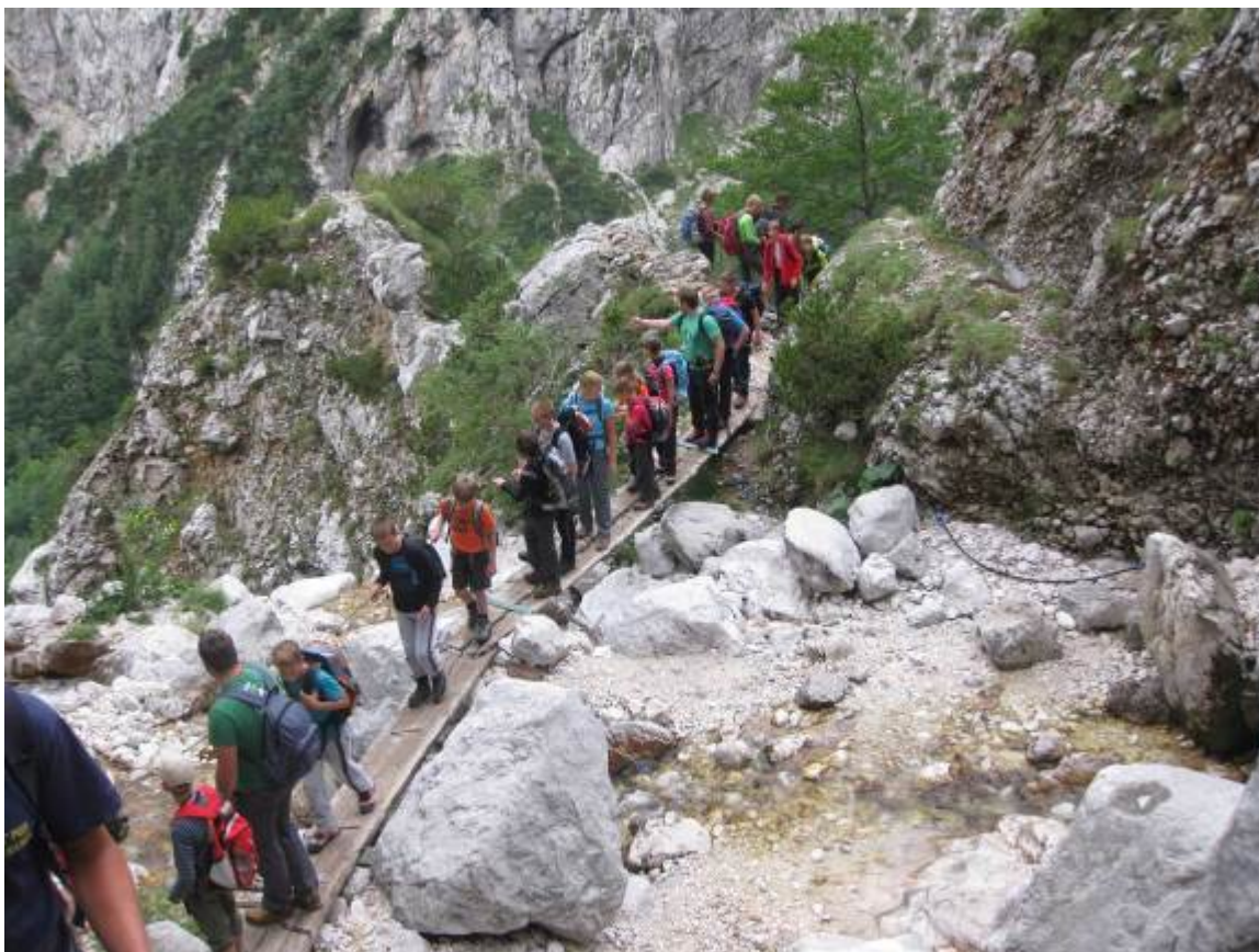
Poletni mladinski tabor v Robanovem kotu