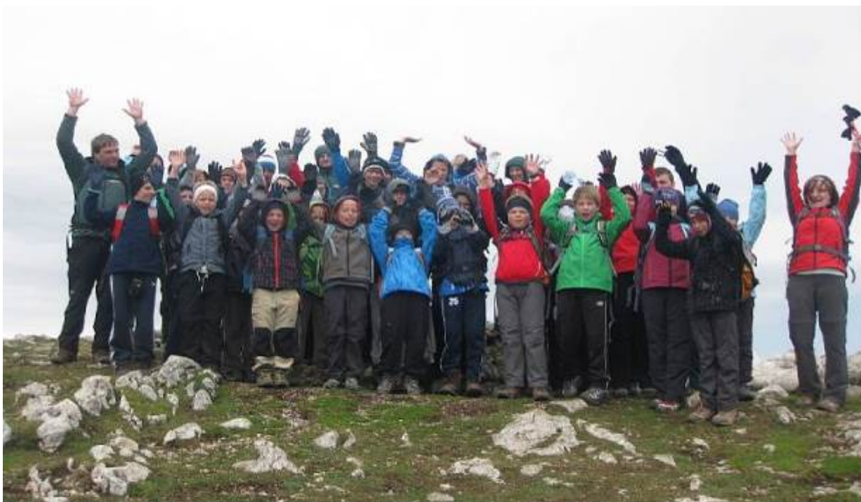
Poletni mladinski tabor v Robanovem kotu