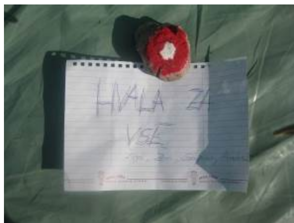
Fotografija iz poletnega mladinskega tabora

Najlepše se zahvaljujemo vsem, ki ste nam pomagali uresničiti naše plane. Poleg navedenih tudi vsem, ki nas podpirate, vendar nam niste poslali logotipa za objavo. Prav tako vsem posameznikom, ki ste nam namenili del svoje dohodnine.