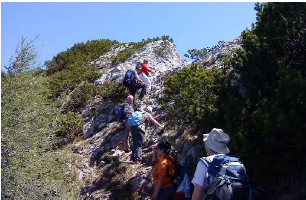
Planinski izlet na Pristovski Storžič