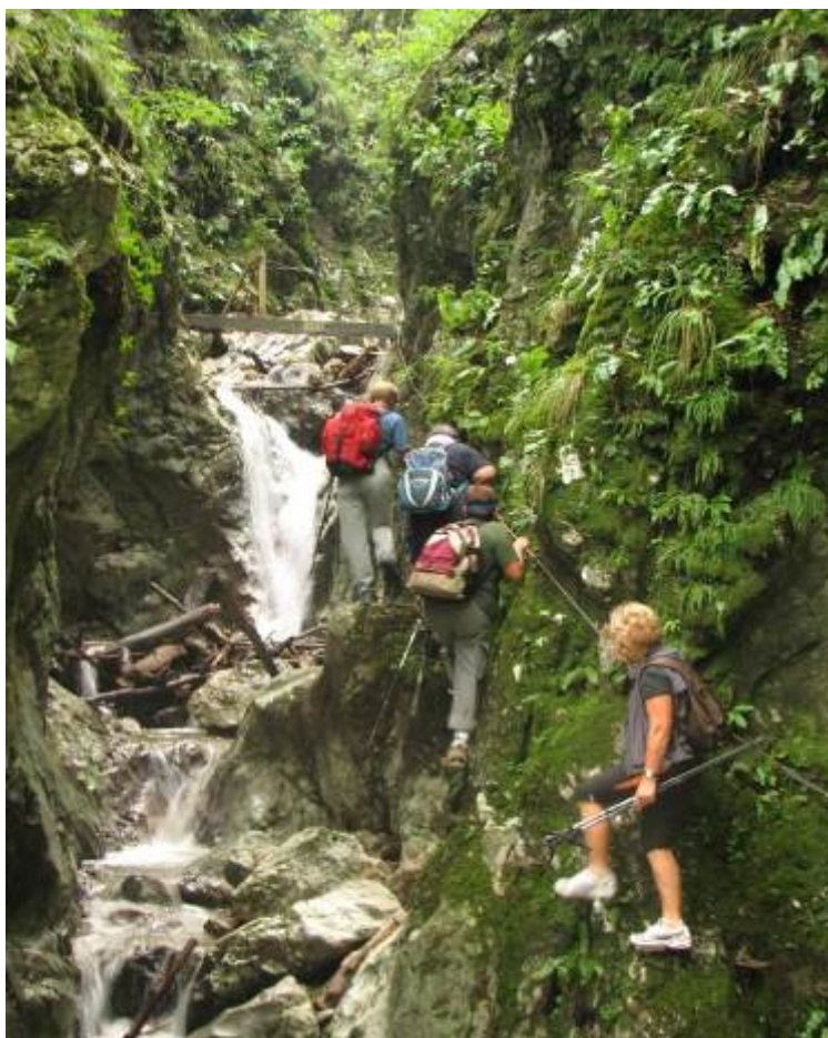
Skozi Hudičev graben na Celjsko kočo