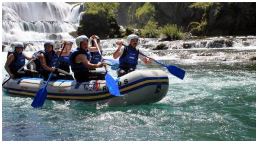
Rafting na Uni