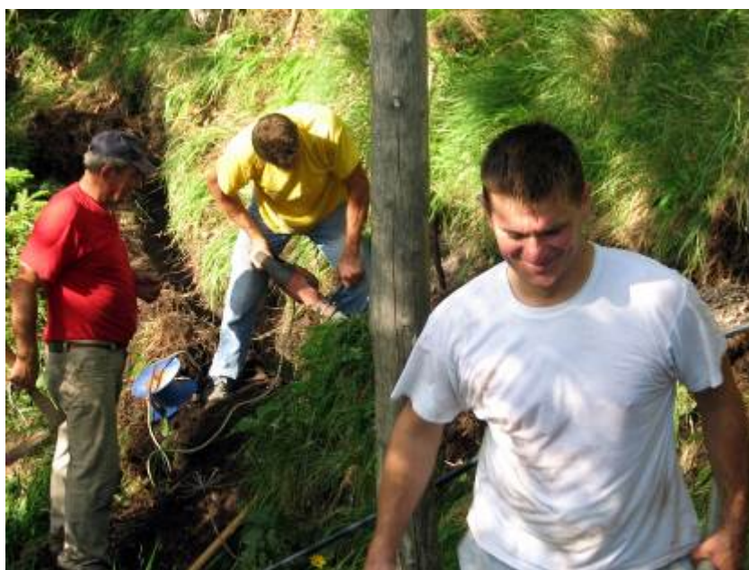
Vkop cevi do vodohrama

Najprej nas je presenetilo daljše obdobje izredno nizkih temperatur v februarju. V koči je zmanjkalo vode. Posumili smo na vodovodno napeljavo v koči, saj so cevi razpeljane na zunanjih stenah, temperature v posameznih prostorih koč pa so bile zelo nizke. Potem se je izkazalo, da sta vodohrama pri Petrovi skali prazna. Gasilci so oskrbeli koč z vodo, ki so jo pripeljali iz doline, mi pa smo morali počakati do izboljšanja vremena, da smo lahko preverili vodno napeljavo. Ugotovili smo, da ja bila najprej napaka v samem vodnem zajetju pri Koritu, posledica pa, da je voda zmrznila v ceveh do vodohramov . Najprej smo uredili vodno zajetje in s pomočjo gradbenih strojev vkopali cev pod cesto ter razpeljali cevi do vodohramov. Ko je sneg skopnel in se teren osušil, smo dali vkopati cev strojno, le zadnjih nekaj deset metrov smo vkopali ročno, saj je tam teren preveč strm in skalovit. Vsem, ki ste sodelovali v delovnih akcijah, se najlepše zahvaljujem za opravljeno delo. Je pa po vsem tem oskrba koč z vodo zanesljivejša, če bo ustrezna skrb za zajetje, vodohrame in kvaliteto vode.