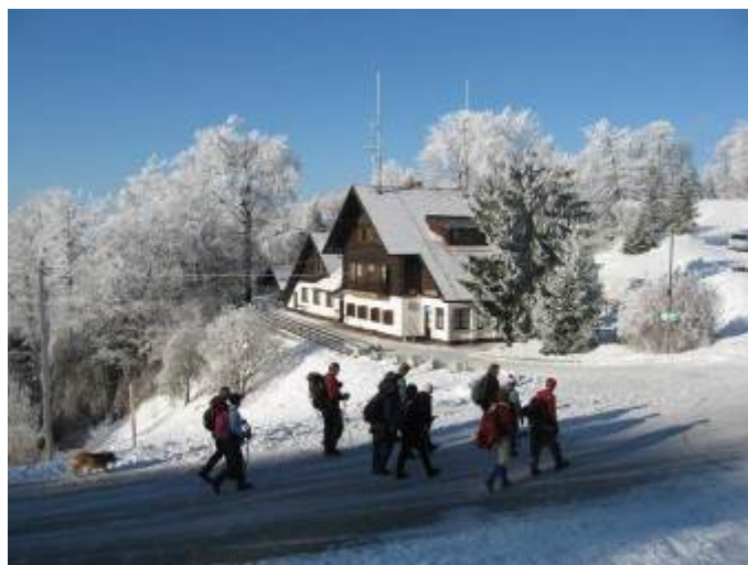
Prihod planincev PD Brežice na srečanje

Januar : Srečanje posavskih planincev na Bohorju