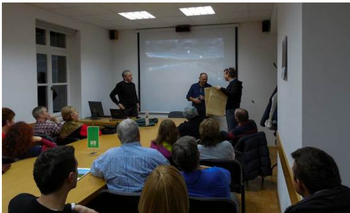
Planinski večer v sejni sobi na Titovi 106, Senovo

Glede na to, da se je oblikovala bolj ali manj stalna skupina 20 – 30 obiskovalcev naših večerov, ocenjujemo, da so vam zanimivi. Veseli smo, da se jih udeležujete in še posebej bomo veseli, če nam boste s svojimi pripombami in predlogi ali celo s sodelovanjem pomagali obogatiti naš program.