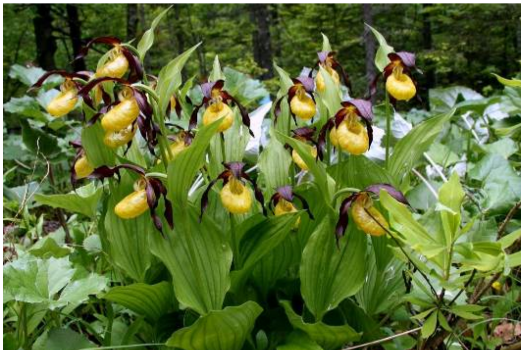
Lepi čeveljc, družina kukavičevk, najlepša slovenska orhideja

Na povratku smo preživelih še nekaj lepih uric na klopcah pred kočo na Klemenči jami, obdani z vrhovi Ojstrice, Krofičke,... Na nepozabno doživetje nas spominjajo lepe fotografije.