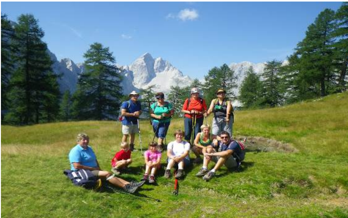
Tabela: Število pohodnikov-seniorjev v letu 2012