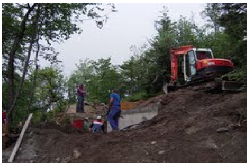
Vzdrževalna dela na vodohramih