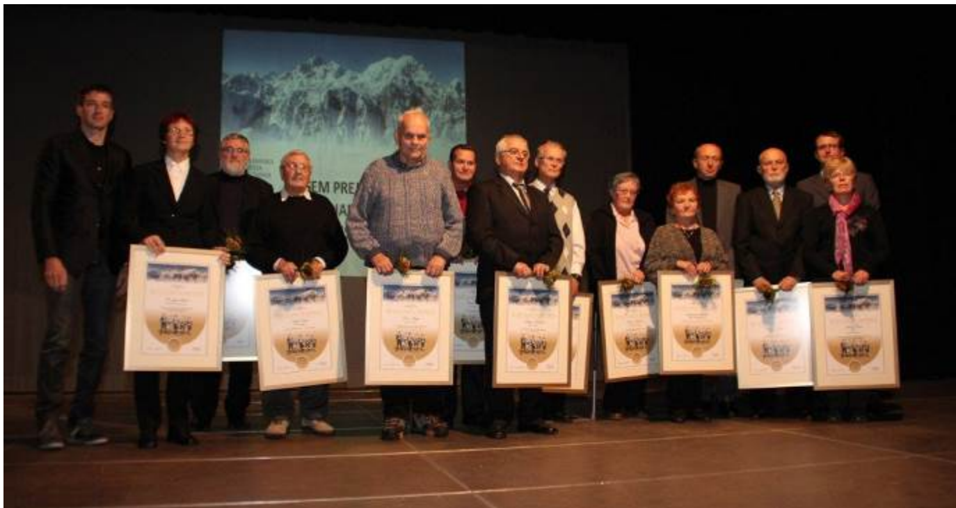
Prejemniki najvišjih priznanj PZS

Pobudnik predloga: Upravni odbor PD Bohor Senovo