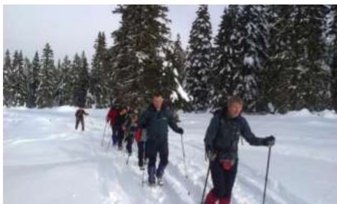
Pohorje - Lovrenška jezera