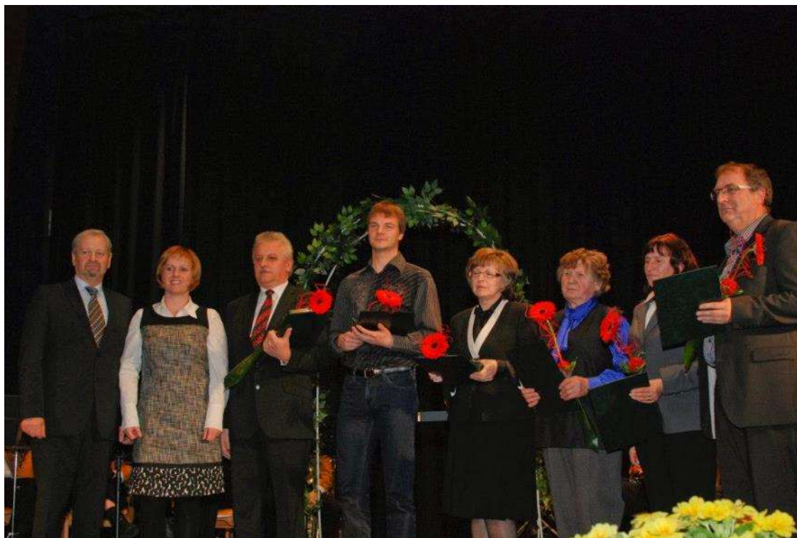
Prejemniki priznanj KS Senovo za leto 2013 – 8. Februar 2014