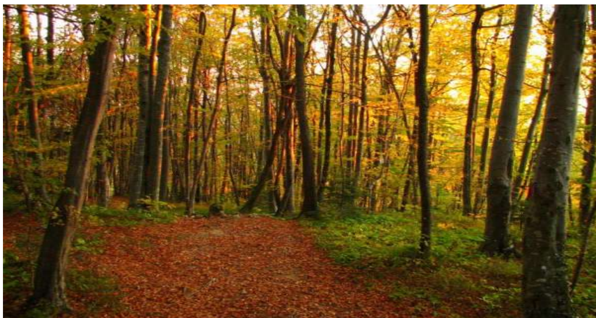
Jesen na Bohorju