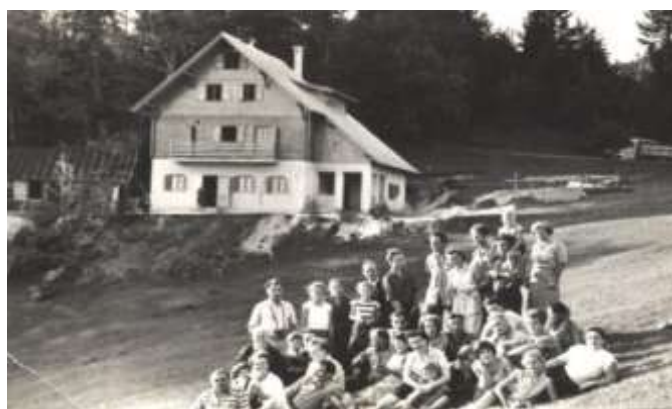
Nova planinska koča na Bohorju

Razvila se je meddruštvena dejavnost, organiziran je bil Koordinacijski odbor zasavskih planinskih društev.