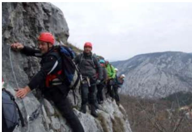
Dolina Glinščice – na ferati Biondi