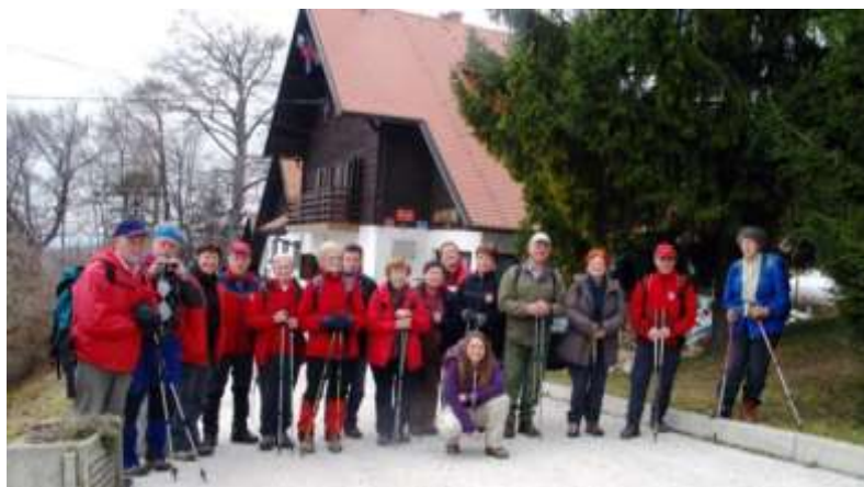
Novoletno srečanje posavskih planincev na Bohorju