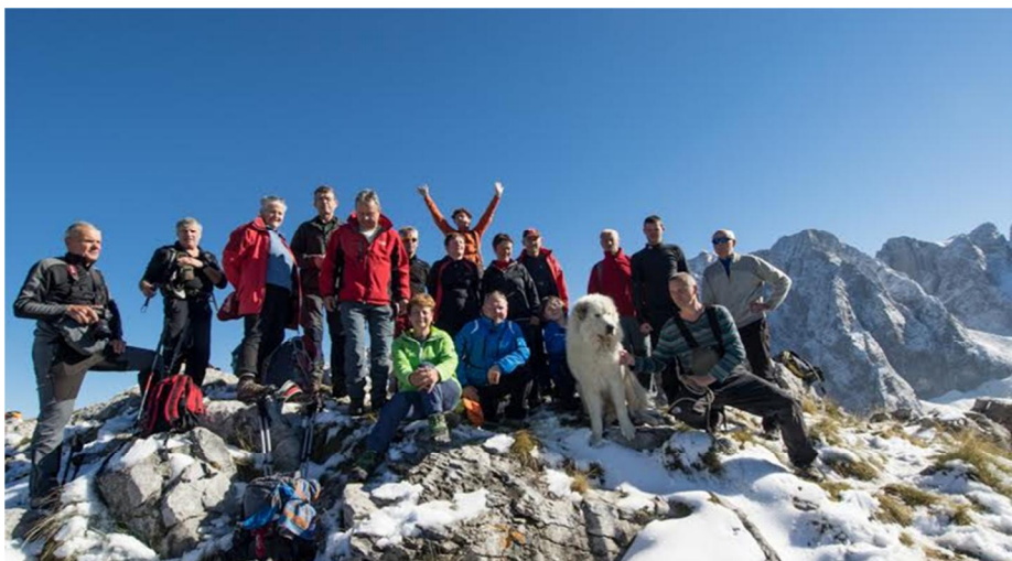
Vandrovci na Prokletijah

V januarju nam je predstavil planinarjenje skupine posavskih planince v Črni gori Povzpeli so se do nekaj jezer in gorskih vrhov v Komovih in na Prokletijah.