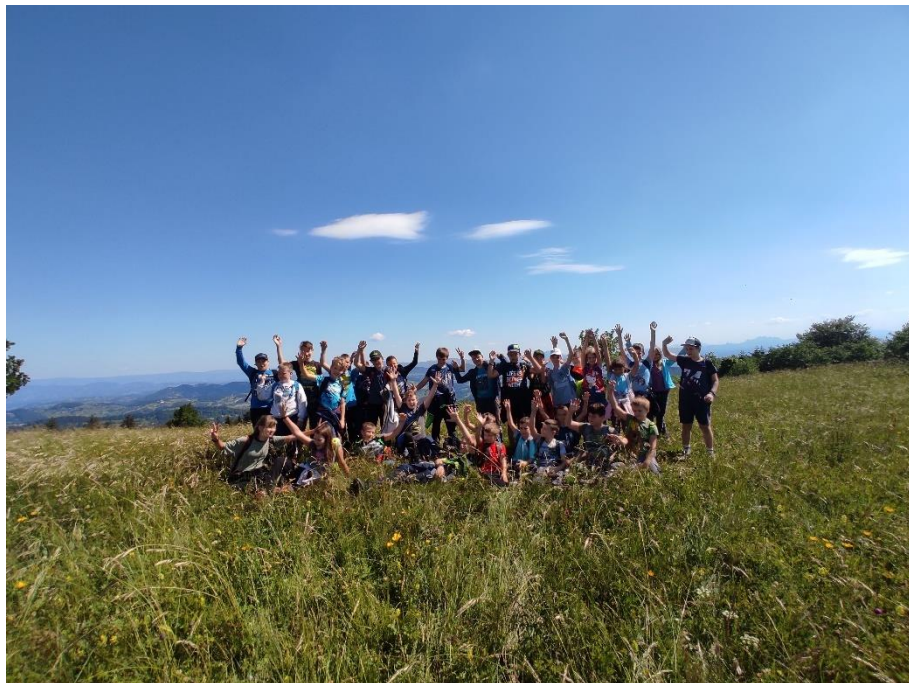
Mini tabor: pozdrav z Oslice