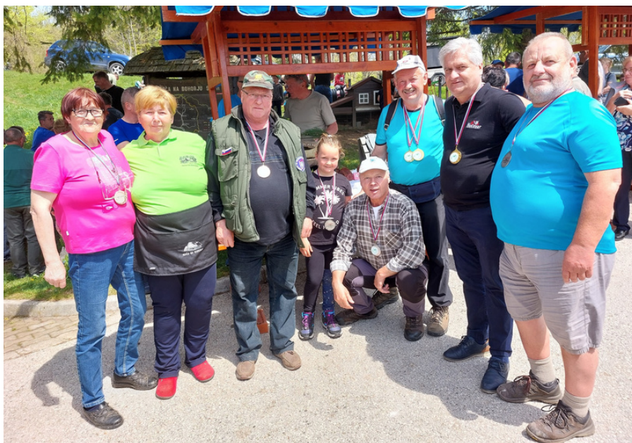
Zmagovalci, foto: Arhiv PD Bohor