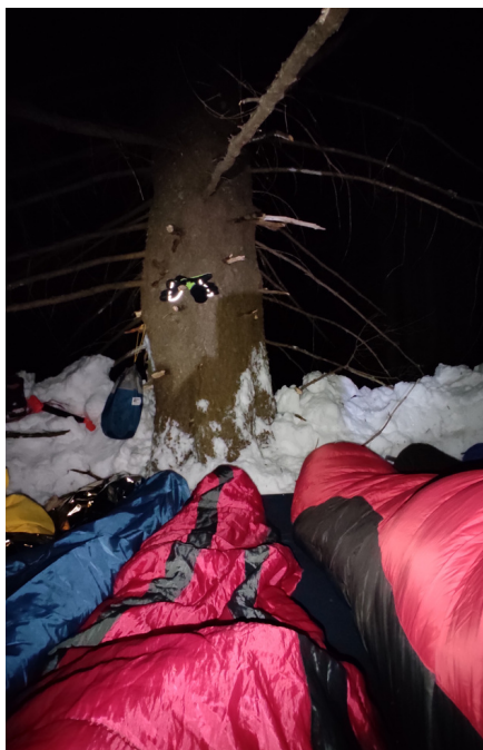
Zimski tečaj in bivakiranje v snegu