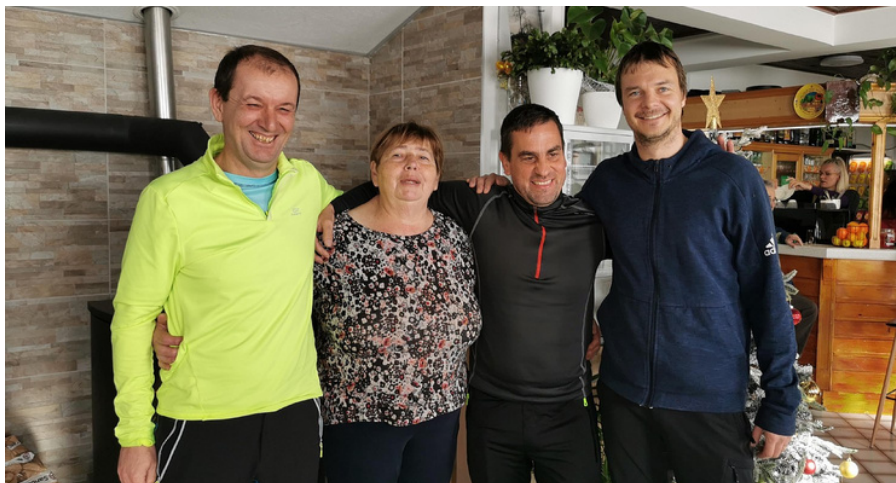
Zaključek akcije Prijatelji Bohorja, foto: Arhiv PD Bohor