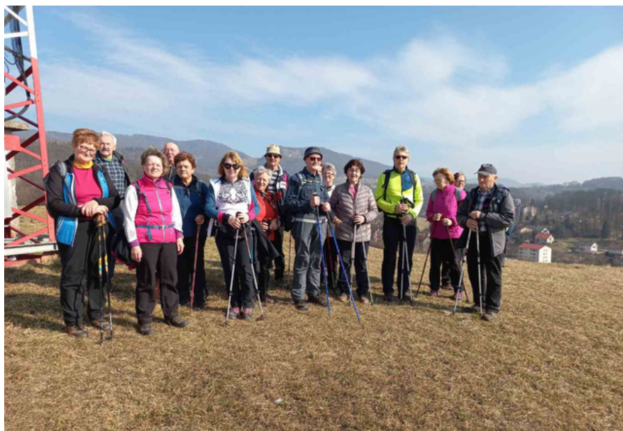
Pohod po senovski Jakobovi poti