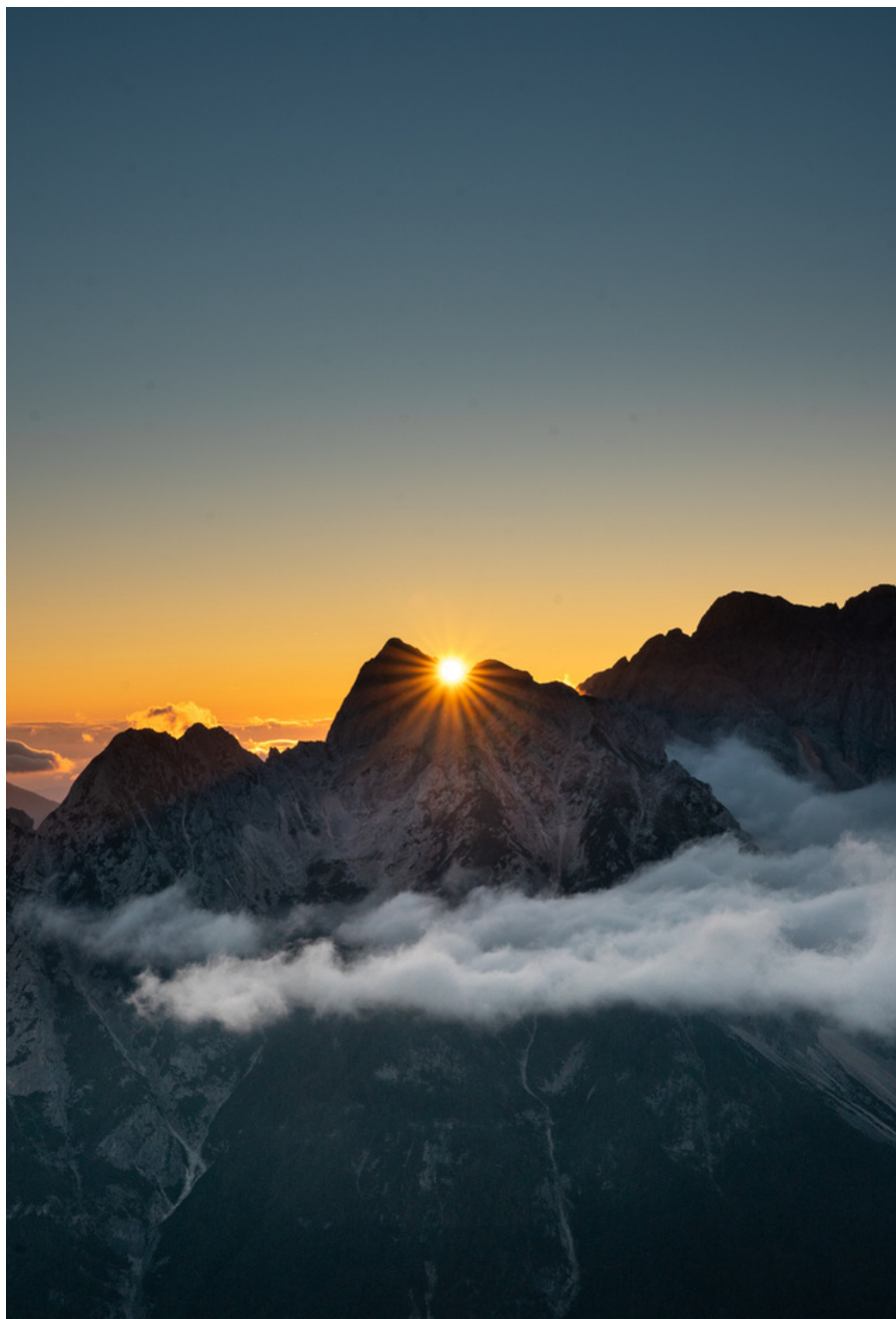
Sončni vzhod na Mali Mojstrovki