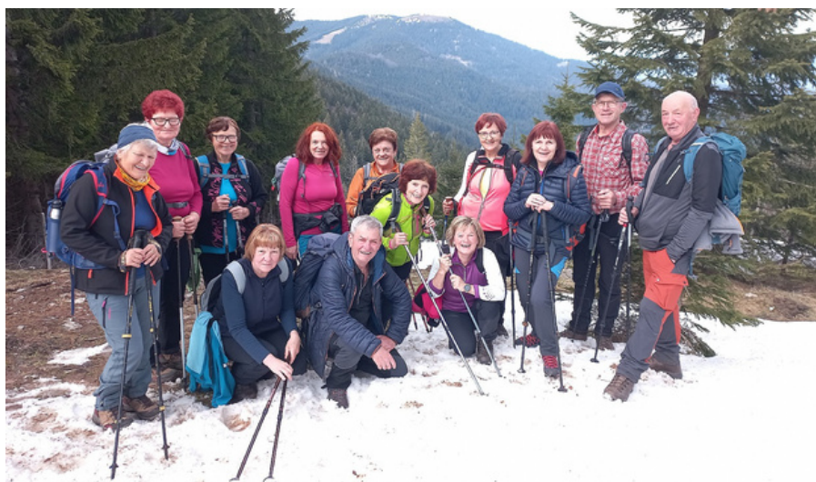
Spomin s Smrekovca