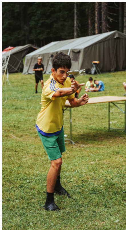
Mladinski planinski tabor 2023