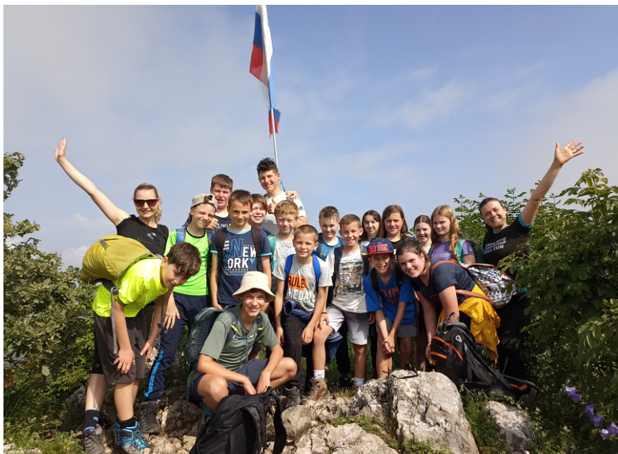
Mladi planinci iz OŠ Senovo

Mentor interesne dejavnosti Mladi planinci Andraž Polutnik