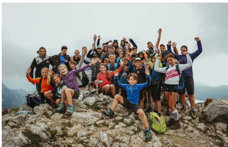
Osvajili smo Viševnik, Mladinski planinski tabor 2023