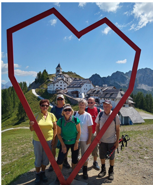
Tabor seniorjev 2023 v Ratečah