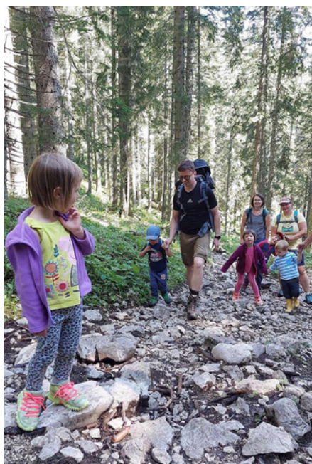
Družinski planinski tabor 2023