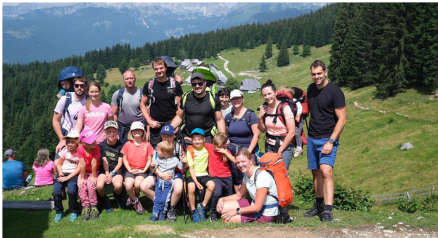
Planina Zajamniki, Družinski planinski tabor 2023

Super kuharice + odrasli v akciji + aktivni, svobodni in nasmejani otroci = uspešen 4. družinski tabor.