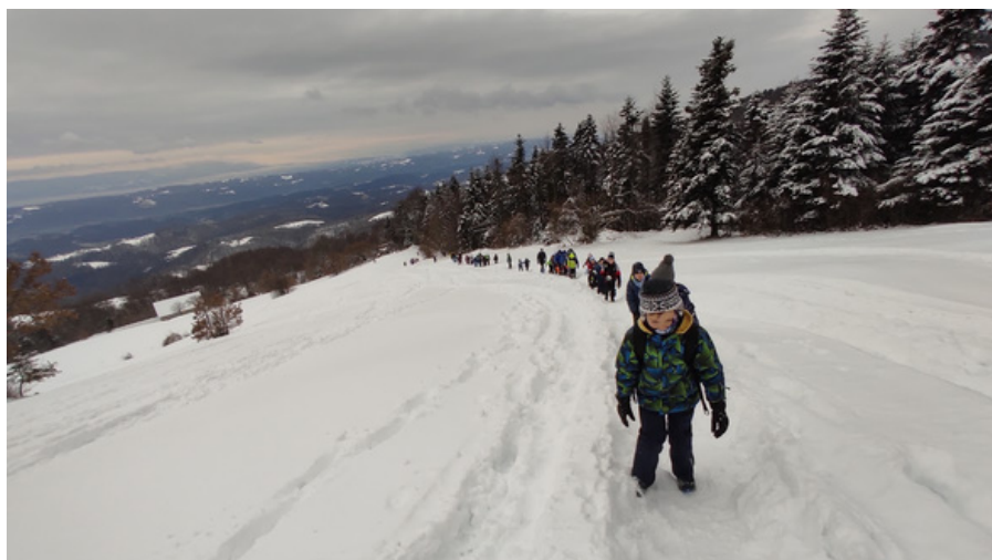
Zimski pohod na Bohor

V preteklem letu, mojem prvem, smo izvedli tri raznolike izlete. Vključevali so krožno pot po Armezu, ki je bila posebej prilagojena najmlajšim, zimski vzpon na idilično zasneženi Bohor ter poletni pohod na Celjsko kočo. Na Armezu smo skupaj z drugošolci prehodili več kot 9 kilometrov dolgo pot, kar nedvomno dokazuje, da tudi najmlajši zmorejo premagati zahtevne planinske izzive. Zimski vzpon na Bohor je bil resnično pravljichen in poseben, saj smo doživeli pravo zimsko idilo, ki je pritegnila tako mlajše kot starejše učence. Uspešen vzpon smo nagradili z okusnimi palačinkami v koči in sankanjem na pobočju Plešivca ter sankoškim spustom v dolino. Leto smo zaključili s pohodom na Celjsko kočo, kjer smo dodatno popestrili izlet z vožnjo z vlakom. Pot nas je vodila iz Štor preko treh vrhov. Strm vzpon smo najprej premagali na Srebotniku, sledil je Tolsti vrh, in po prijetnem druženju na Celjski koči, smo pot nadaljevali proti Grmadi. Pohod smo sklenili v Celju in se zapolnjeni s pozitivnimi občutki vrnili domov.