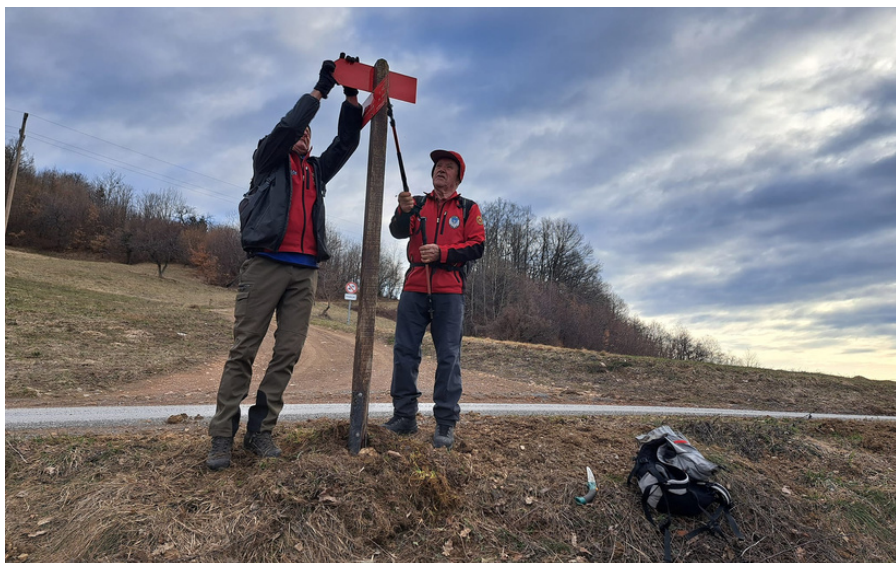
Srečanje markacistov MDO Zasavja Posavja