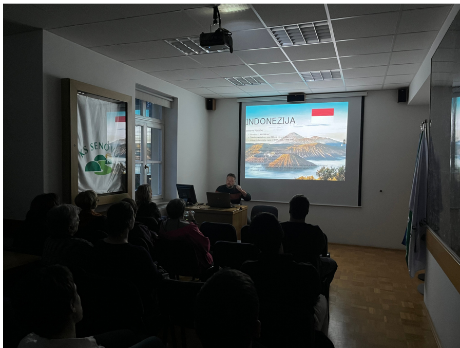
Potopisno predavanje - Indonezija