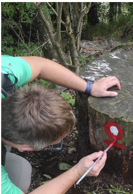
Delovna akcija