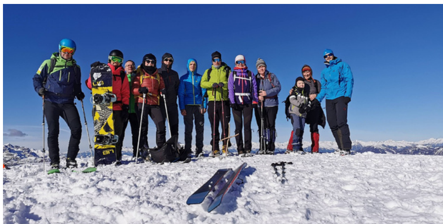
Cima Bella