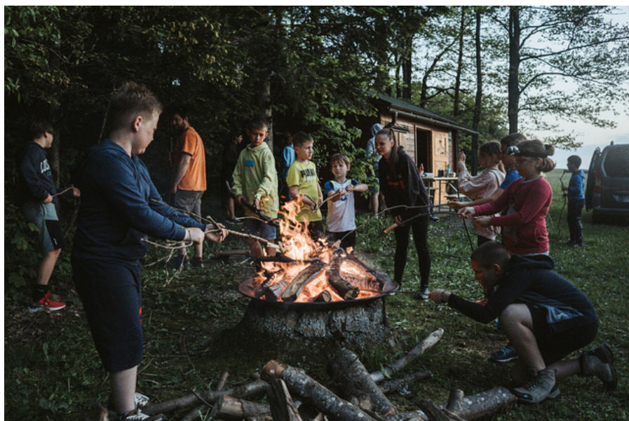
Večerja na Mini tabru, Ravni Log

V juniju smo izpeljali 2 projekta. Na Ravnem Logu smo uspešno organizirali mini tabor, ki se ga je udeležilo kar 43 otrok. Obiskali so nas lovci, ki so otrokom predstavili svoje delo za ohranjanje narave. Razložili so jim pomen varstva živali in naravnega okolja. Spomladi smo sodelovali tudi z Zavodom za mladino in šport Krško. Skupaj smo izvedli planinsko šolo in pohod na Grmado.