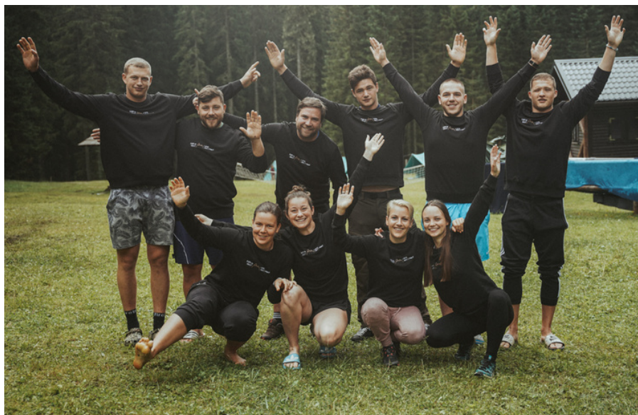
Ekipa vodnikov in animatorjev, Mladinski planinski tabor 2023