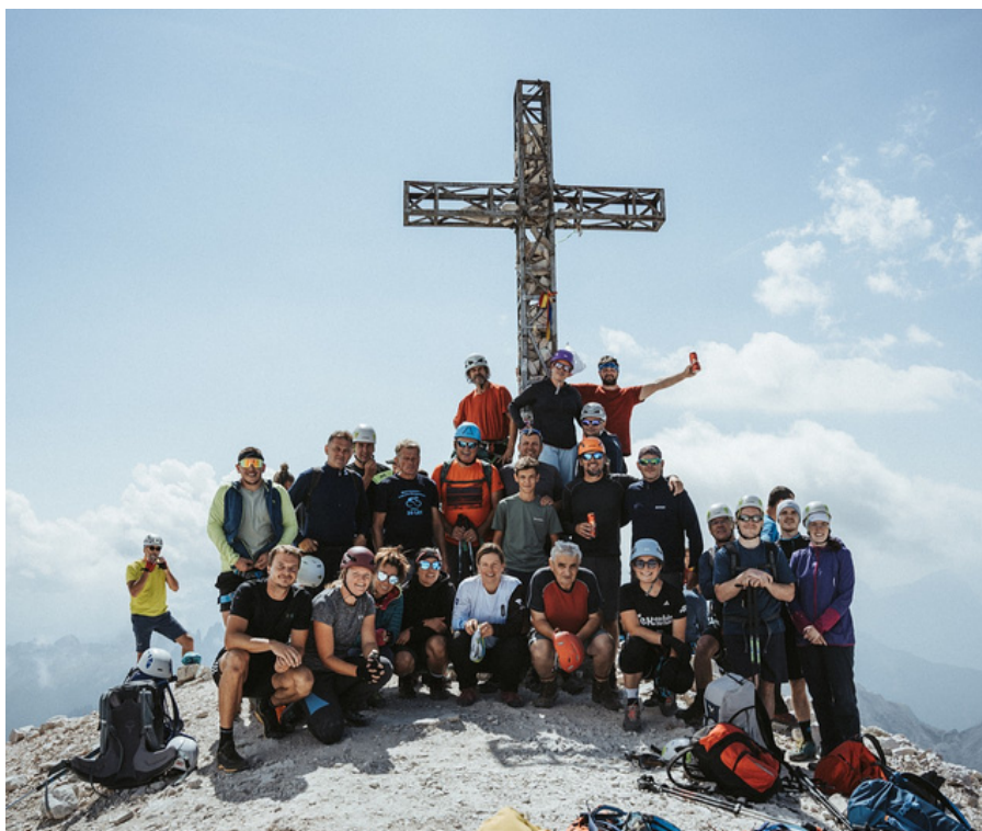
Tofana di Rozes, foto: Arhiv PD Bohor