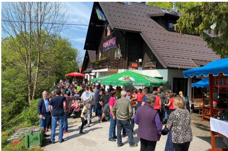
Jezikova nedelja, foto: Arhiv PD Bohor