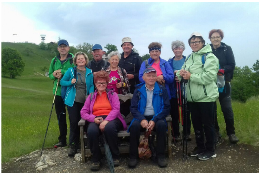
Pohod na Lisco, foto: Arhiv PD Bohor