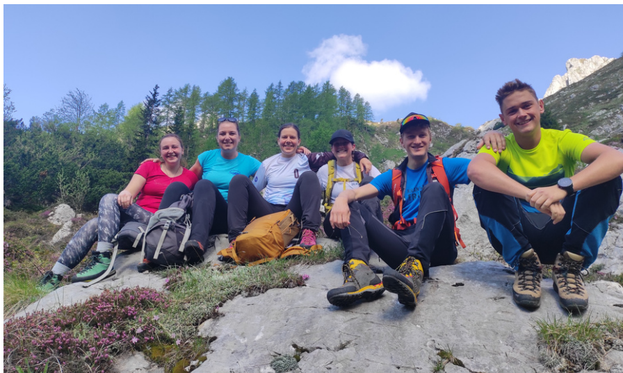
Tečajniki na turi, Planina Bala