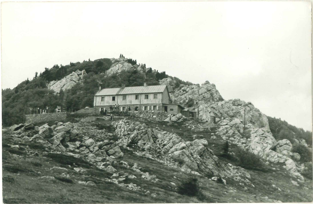
Dom na Zavižanu