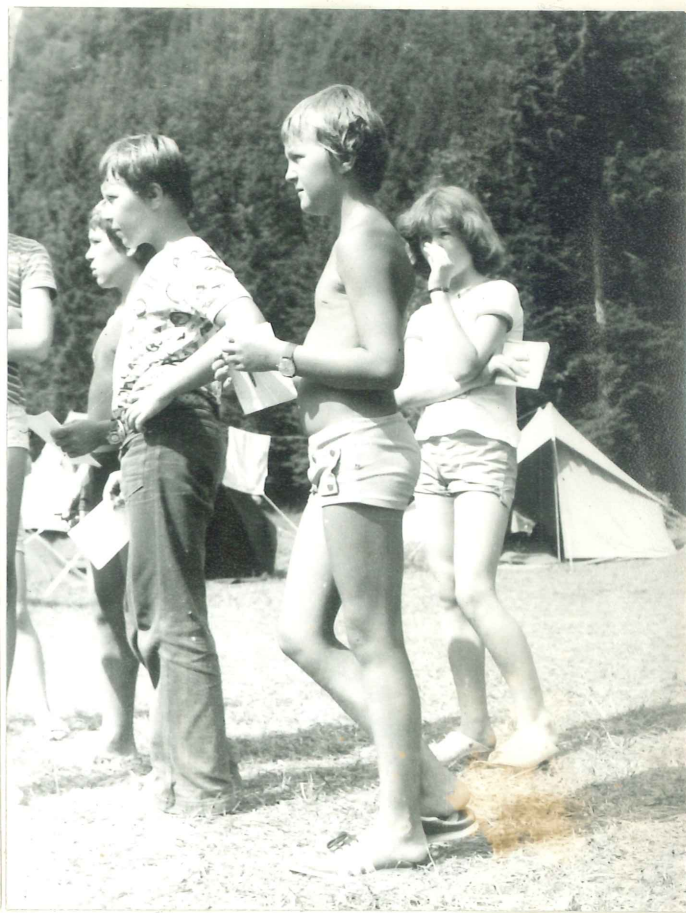
Nadebudni planinci iz Brestanice