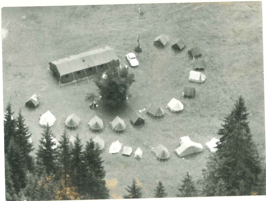
Pogled na tabor "s ptičjega pogleda"