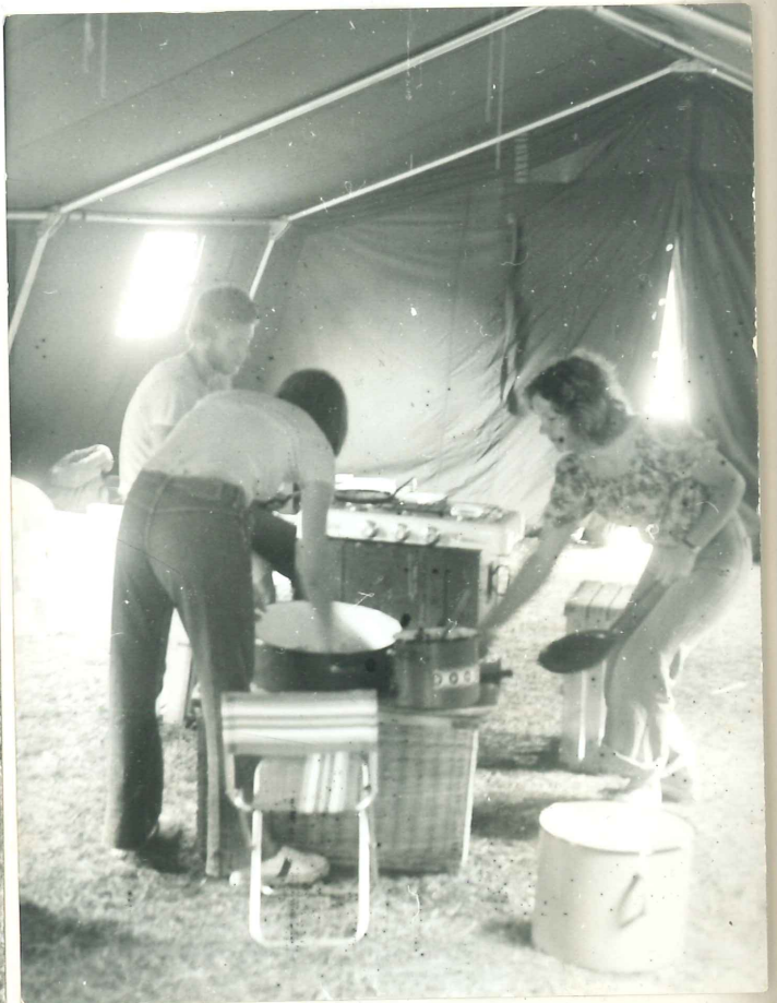
Ni pala, speči 400 palačink