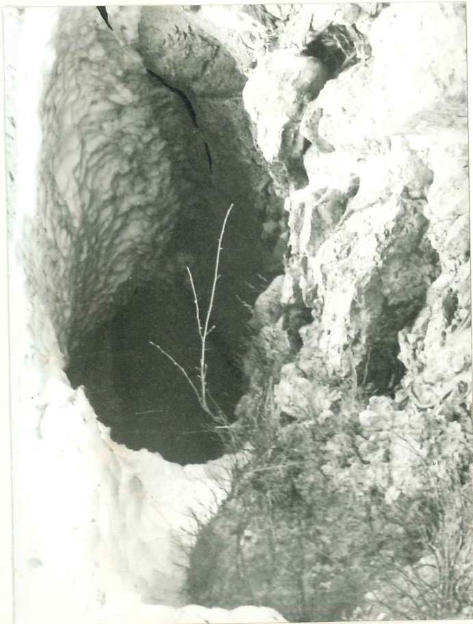
Črna luknja pračloveka