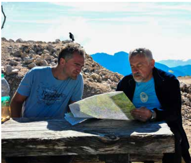
Posvet na Grintovcu

Tudi minulo leto so vodniki skrbno vodili ture. Pri izvedbi izletov so nam pomagali tudi prijatelji iz drugih društev: Janko Meglič, Štefan Močnik in Borut Vukovič. Z vseh poti so se udeleženci vrnili brez poškodb. Odpadlo pa je več izletov: 2 x zaradi nevarnosti plazov, 6 x je pohod onemogočilo slabo vreme, 5 x premalo prijavljenih, 2 x pa izlet ni bil razpisan zaradi odpovedi vodnika. Število udeležencev je največje na tradicionalnih pohodih in na izletih v taboru. Sicer pa se še kar nadaljuje nižja udeležba na turah v oddaljene gore, kjer so stroški višji.