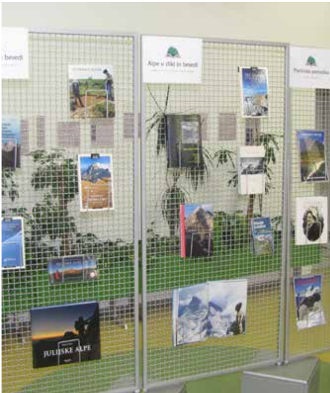
Razstava alpske literature, Brati gore 2016