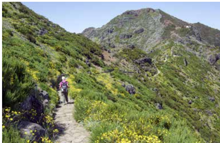
Pot na Pico Ruivo

Funchal je glavno mesto že več kot pet stoletij. Ime izhaja iz besed „funcho” in „al”, kar pomeni „plantaža navadnega komarčka”, rastline, ki jo je na otoku našel prvi prispeli kapitan. Leži v amfiteatrsko oblikovani dolini s pobočji, ki se dvigajo od morja do 1200 m