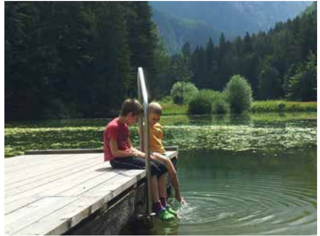
Ob Planšarskem jezeru