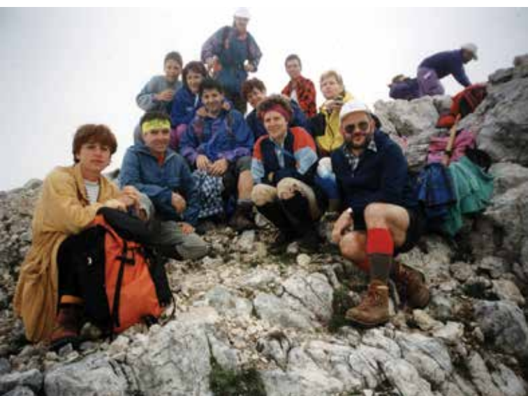
Na Stenarju, julij 1994