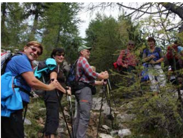
Torkarji gredo na Debelo peč.