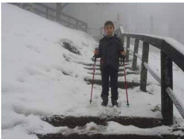
Pod Kočo pri Gospodični

20. februarja smo v hladnem in meglenem zimskem dnevu osvojili TRDINOV VRH, 1178m . Začeli smo v Gabrjah. Pot je bila kar zahtevna, ker je bilo do polovice poti veliko blata in nam je močno drselo. V Koči pri Gospodični smo se pogreli in okrepčali. Od kočice do vrha smo hodili po snegu, kar je bilo še posebej zanimivo. Na vrhu nismo ostali dolgo, ker je bilo vetrovno in mrzlo. Na poti nazaj smo se ustavili še pri čarobnem izviru pri Gospodični, o katerem legenda pripoveduje, da zagotavlja večno mladost. Tako smo se sveži in mladi vrnili v dolino.