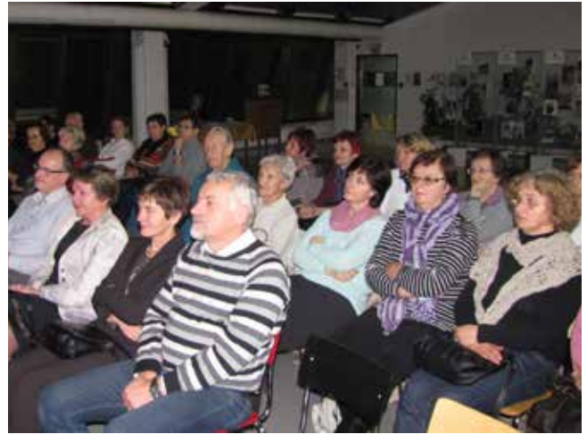
Brati gore 2016