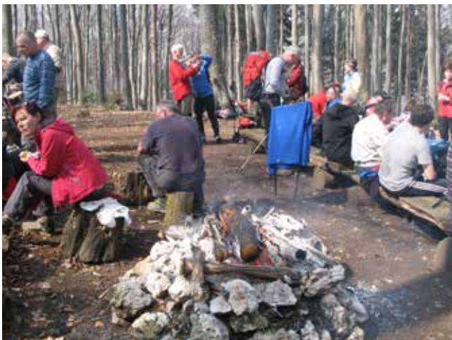
Na Velikem Cirkniku