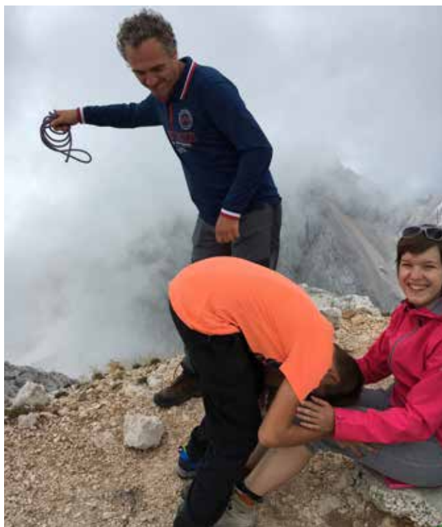
Krst na Grintovcu