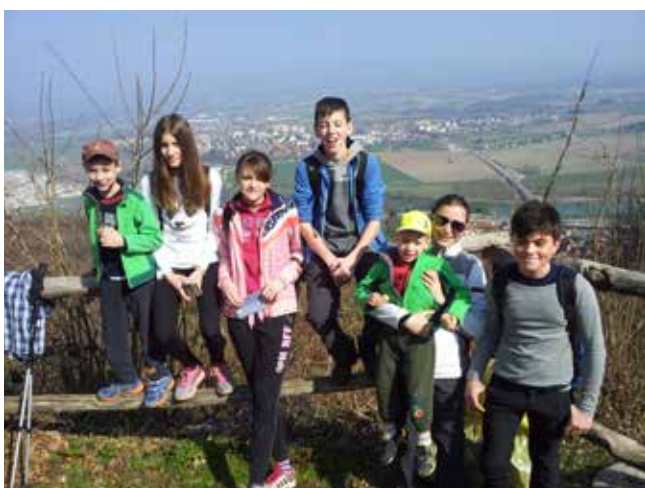
Na Šentvidu v sončku

20. marca smo se udeležili tradicionalnega POHODA PO BREŽIŠKI PLANINSKI POTI , ki se ga je udeležilo več kot 100 planincev. Start je bil na Čatežu, pot nas je pa vodila čez Šentvid in Veliki Cirknik v Globočice. Za najmlajše nogice je bila kar naporna, ampak ob lepem vremenu in v super družbi je bilo to zabavno in prijetno doživetje.