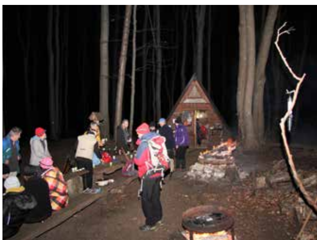
Nočni pohod na Veliki Cirknik