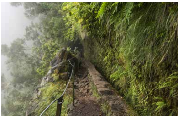
Levada v strmini

nastanitev v hotelu s štirimi zvezdicami, za vse obroke in prevoz na letališče. Bilo je kot lepo darilo.