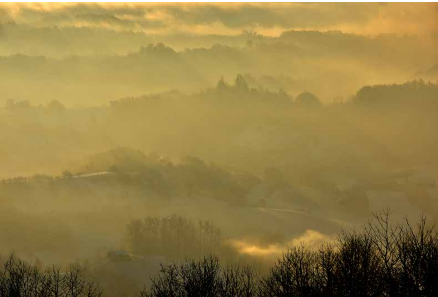
Orlica