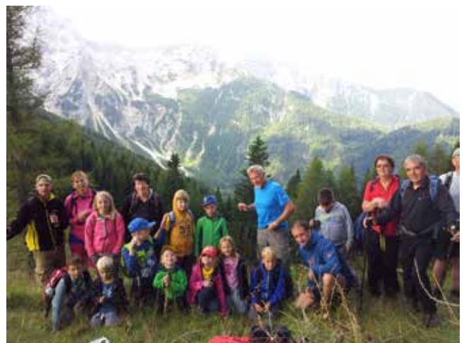
Pod Veliko babo