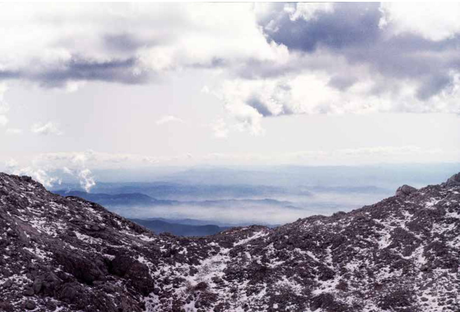
Utrinek z vrha Turskega žleba

V letu Alp smo planinci doživljali različne dogodke, ki so prebujali spomine in kar ponujali vprašanje, kaj nam pomenijo. Za Slovence so zelo pomembne, saj predstavljajo del življenjskega prostora, če pa prištejemo še ves predalpski svet, dobimo že polovico naše deželice. Našega raja. Verjetno so večini Evropejcev kar sinonim za gore. Meni pomenijo še eno misel več – izgubljeni raj. Čeprav ga nisem izgubil, temveč zapustil, saj sem se odselil iz predalpske doline na obrobje nižine. Kratek skok, 100 km, pa kar velika ovira, ko želim med oblake, saj predstavlja vsaj dobro uro vožnje več, kadar si zaželim tja gor.