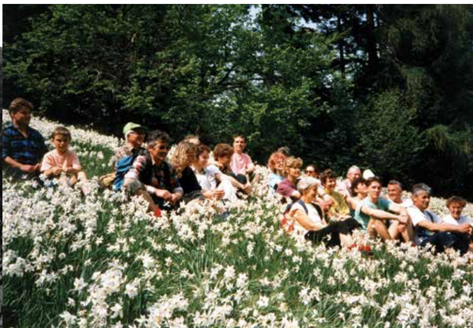
Javorniški rovt, 17. 5. 1992