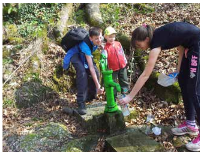
Na poti proti Globočicam smo odkrili tudi osvežilne izvire.