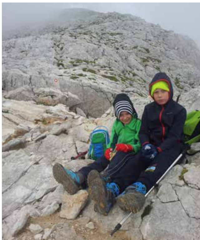
Postanek pod vrhom