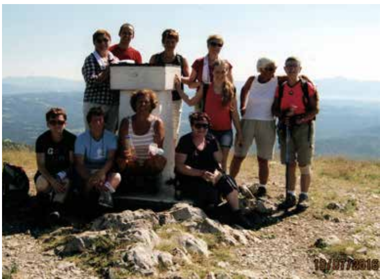
Na vrhu Slavnika

Poletni dnevi so dolgi in tako smo lahko opravili, kar je bilo načrtovano. Še sedaj se radi pogovarjamo o doživetem na tem primorskem izletu.