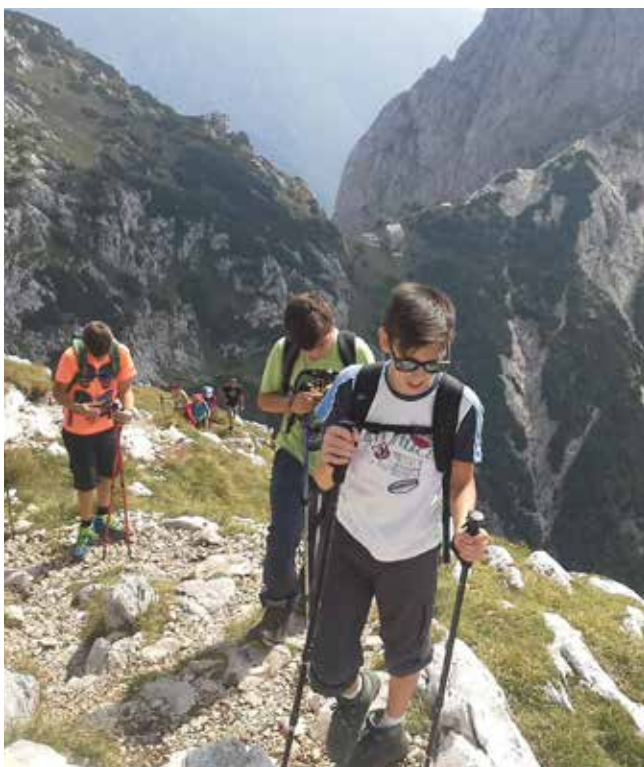
Še malo ...

Že ob štirih smo se zbudili v zaspano jutro, ki se je razjasnilo v sončen dan. Krenili smo proti Kamniški Bistrici. Ob vzponu se je začelo daniti. Pot navzgor je bila zahtevna, s kratkimi počitki pa zabavna. Na pol poti smo se ustavili pri Cojzovi koči in pomalicali. Kmalu smo nadaljevali pot proti Grintovcu, najvišjemu vrhu Kamniško-Savinjskih Alp. Na vrhu, 2558m, smo imeli kratek postanek, nato pa smo se odpravili nazaj proti koči. Ko smo prišli do parkirišča, se je že začelo nočiti, zato smo se hitro odpeljali domov. In spet imamo novo izkušnjo.