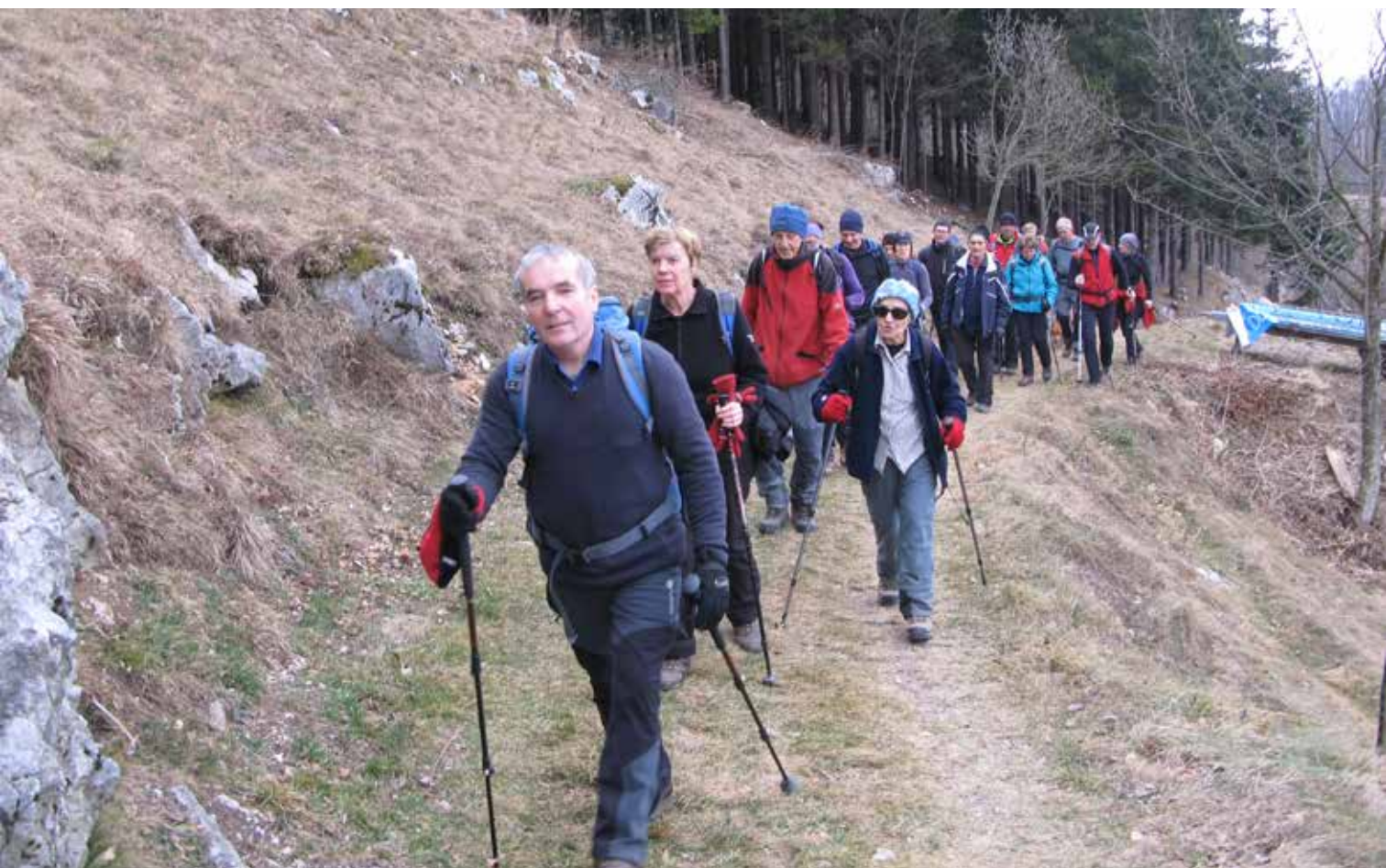
Na Kum, januar 2016