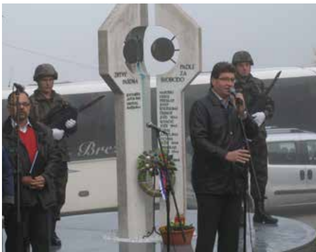
Župan pozdravlja udeležence pohoda Po poteh Brežiške čete 2016

Izvedli smo ga na martinovo nedeljo 13. novembra 2016. Sodelovalo je 68 udeležencev iz PD Pošta Telekom Ljubljana, PD Krško in iz domačega