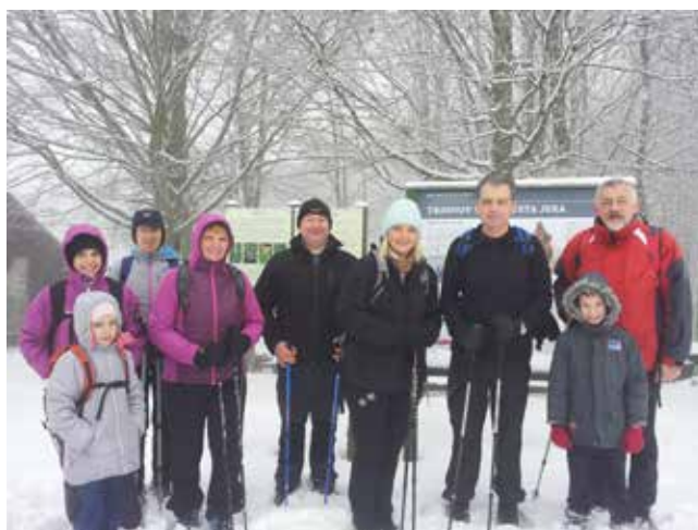
Na vrhu pred stolpom, ki se v megli komaj vidi.

20. marca smo se udeležili tradicionalnega POHODA PO BREŽIŠKI PLANINSKI POTI , ki se ga je udeležilo več kot 100 planincev. Start je bil na Čatežu, pot nas je pa vodila čez Šentvid in Veliki Cirknik v Globočice. Za najmlajše nogice je bila kar naporna, ampak ob lepem vremenu in v super družbi je bilo to zabavno in prijetno doživetje.