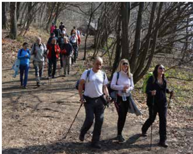
Po Brežiški planinski poti