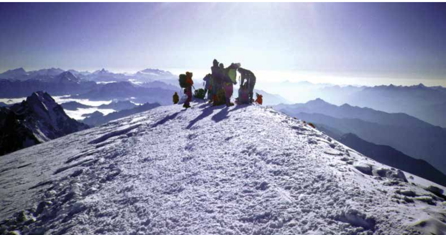
Na vrhu Mont Blanca

Zapis o vzponu na Mont Blanc je za dogodek BRATI GORE 2016 z dovoljenjem avtorja skrajšala Milena Jesenko.