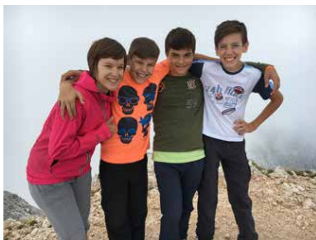
Naši najvztrajnejši mladi planinci