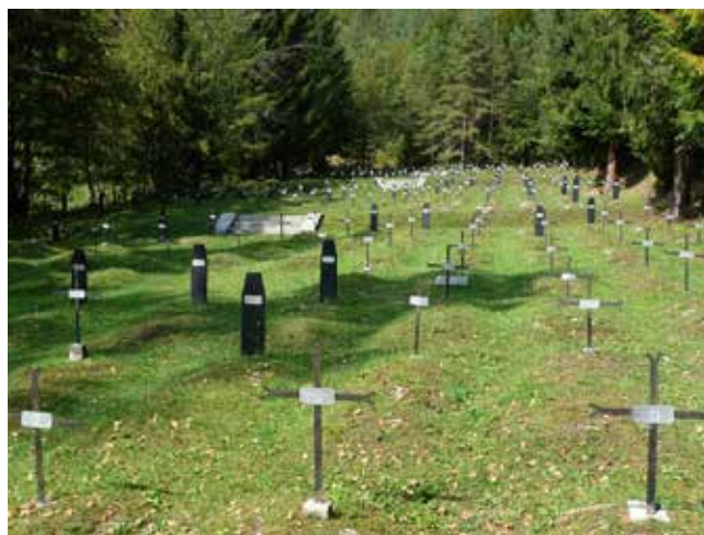
Pokopališče v Logu pod Mangartom