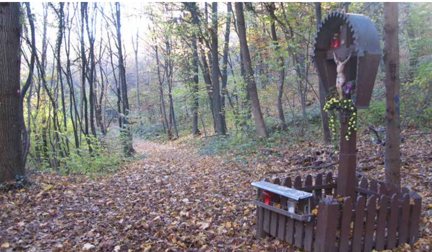
Znamenje na razpotju