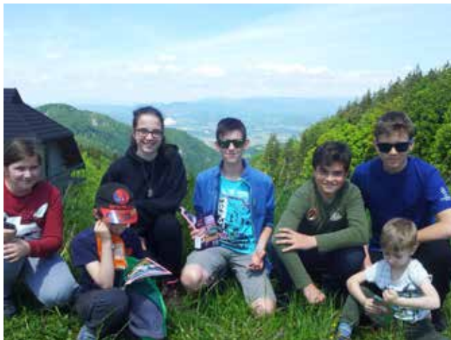
Po podelitvi priznanj vztrajnim planincem

Eno srebrno in dve zlati priznanji sta pripadli tudi REI BERGANT , ki se izleta ni mogla udeležiti.