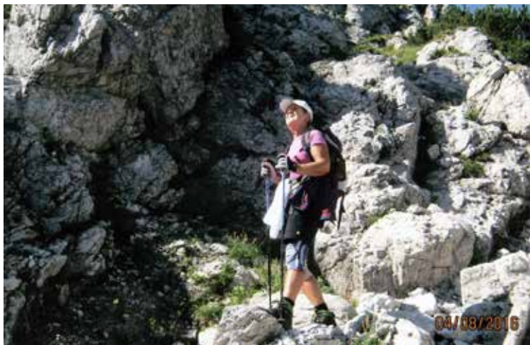
Kje si, kočica?

Oskrbnika, zakonca, naju pristrčno pozdravita. Poznamo se že tri leta. Nekaj pojeva in že nadaljujeva proti Skuti. Veter je še vedno močan. Hodiva počasi, noge so težke. Z rokami se oprijemava skal, za hrbtom je globok prepad. Strah obvladam, prijetno pa ni. Marjan je dosti bolj pogumen in spreten, ima pa težave s kolkom. Končno prideva do bivaka pod Grintovcem. Imenuje se po alpinistu in gorskem reševalcu Pavletu