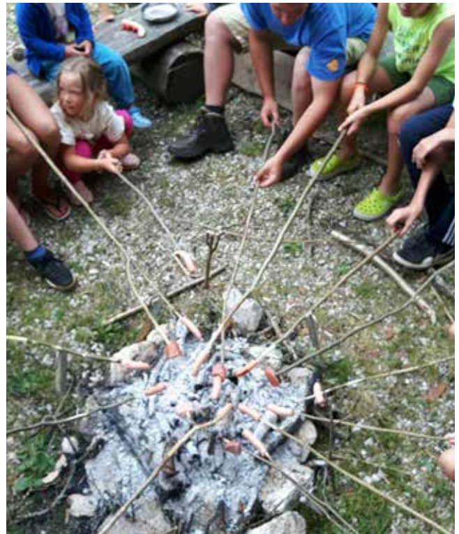
Ob tabornem ognju je dišalo 😊.