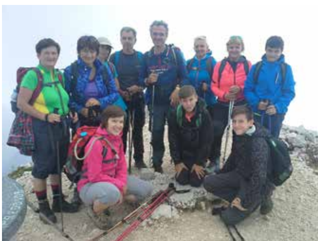
Vrh Grintovca, 2558 m