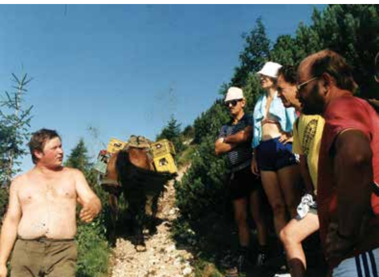
Ubogi konj na poti na Stol in izmenjava informacij, avgust 1992