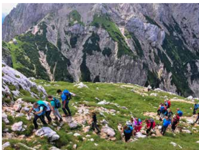
Počasi se daleč pride