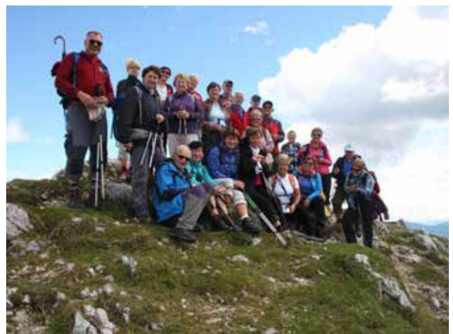
Torkarji na cilju – Debela peč