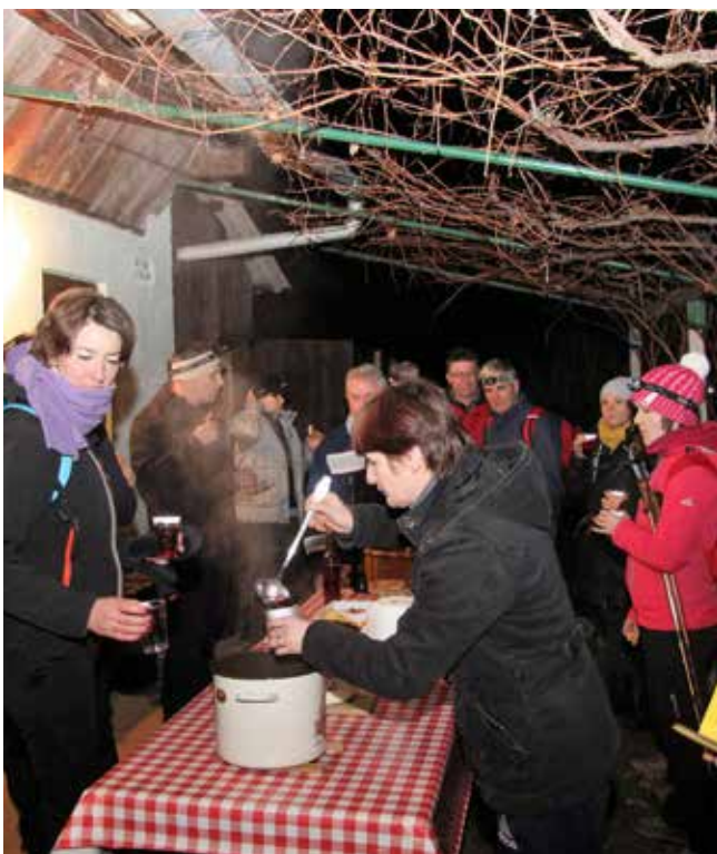
Nočni pohod na Veliki Cirknik