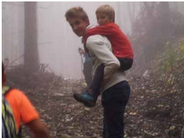
Ko se male nogice utrudijo ☺...

16. oktobra smo se pridružili planincem na izletu na GORE KOPITNIK.