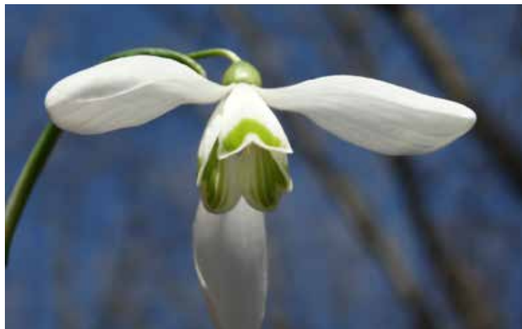
Galanthus nivalis

Letnega programa nismo v celoti realizirali, zaradi slabega vremena je odpadel izlet na Ljubljansko barje, predviden za 5. 6. 2016.