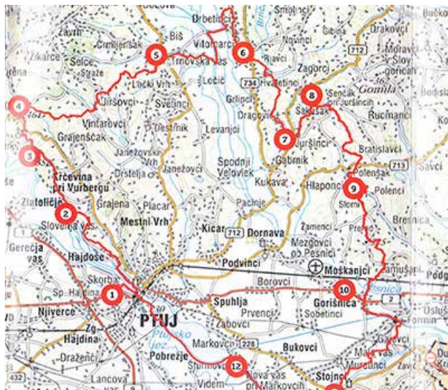
Kontrolne točke na Slovenjgoriški obhodnici

Naslednje leto, 2014, smo se spomladi odločili prehoditi tretjo etapo, tj. pot od Trnovske vasi do Vitomarcev in Juršincev. Na tem delu smo si ogledali kužno