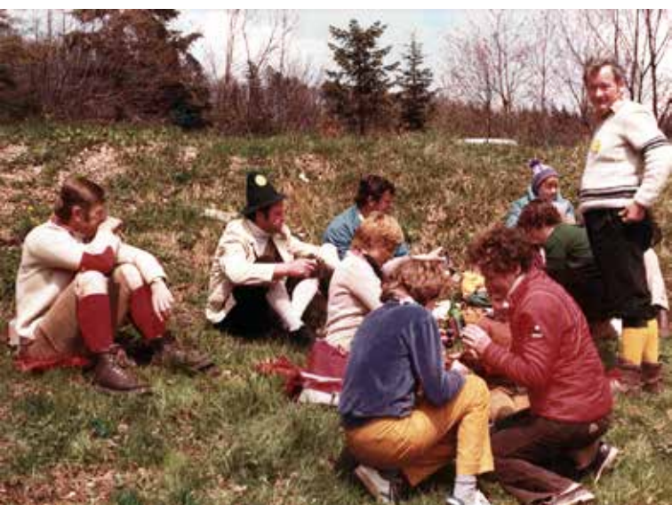
Jezikova nedelja, Bohor 1981