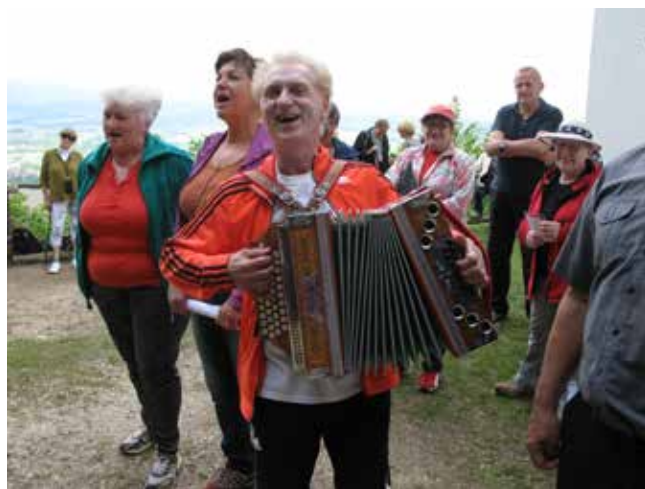
Bilo je veselo.