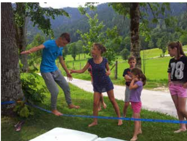
Hoja po vrvi