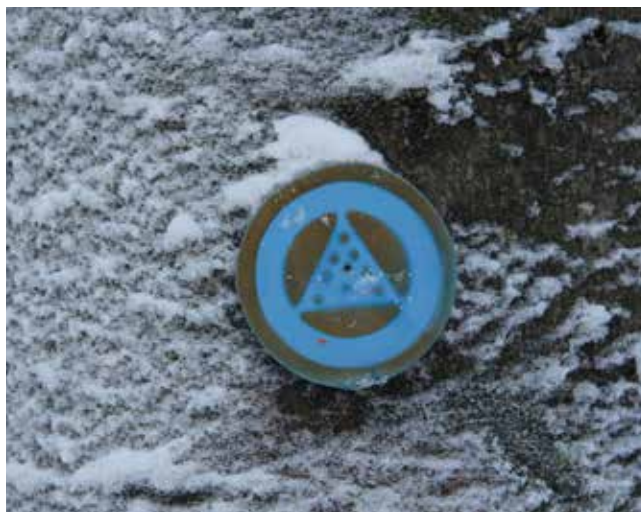
Markacija za Pot slovenskega tolarja