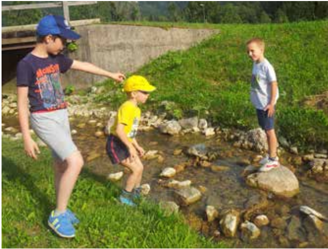
Igre v potoku