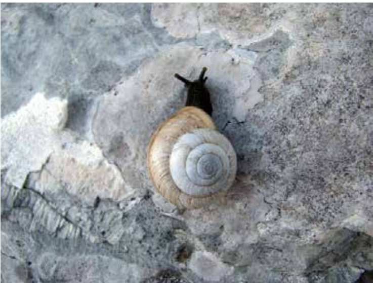
Sam, foto arhiv PD

Delo naravovarstvenega odseka, usposobljenih varuhov gorske narave, vključuje tudi različne dejavnosti znotraj planinskega društva, ki so v tesni povezavi z naravo. Tako smo v letu 2014 izvedli kar tri naravovarstvene akcije.