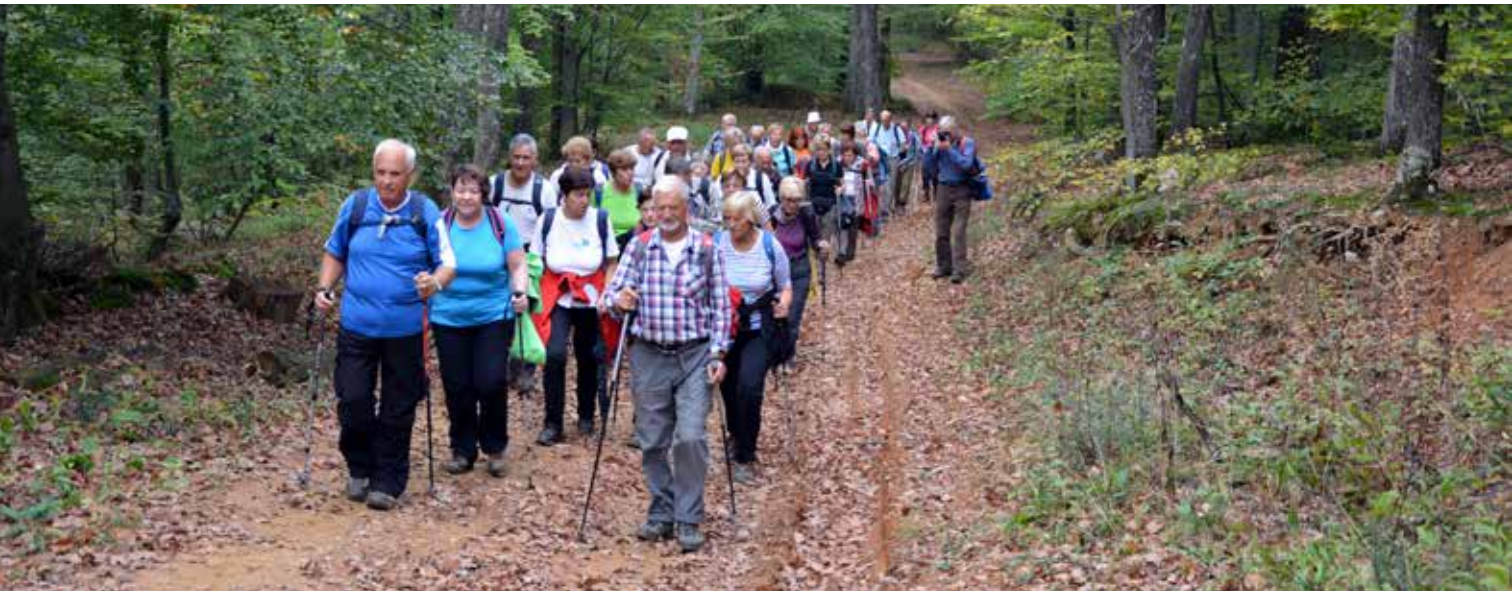
Veselo na Sljeme

Ko sem se pred dvema letoma vključila med brežiške planince, nisem slutila, kako lepo je, ko si v družbi ljudi, ki imajo na dan pohoda iste cilje - da se imajo lepo, da se nadihajo svežega zraka, razgibajo v hoji in poklepetajo v sproščenem pogovoru. Osebnost sem poznala zelo malo njenih članov. Povedali so mi, da je njihov vodja Marjan Rovani. Že prvi pogovor z njim je bil prijeten in je name naredil močan vtis. Sčasoma sem spoznala tudi druge pohodnike in moram priznati, da se odlično počutim v njihovi družbi.