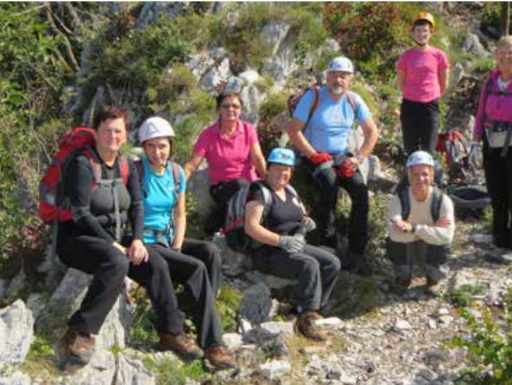
Opremljeni za vzpon po Gradiški turi