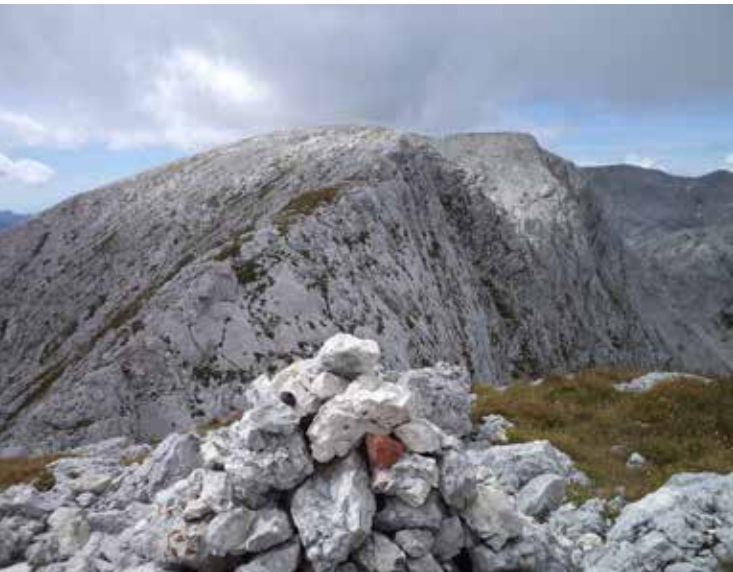
Debeli vrh