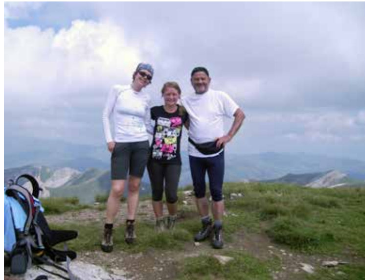
V makedonskih gorah