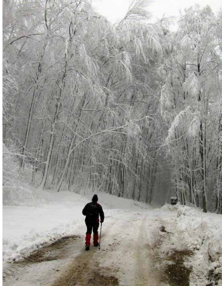
Zima na Gorjancih, foto Zdenko Galič