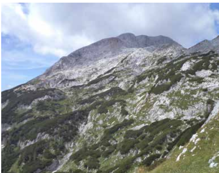
Zadnji Vogel