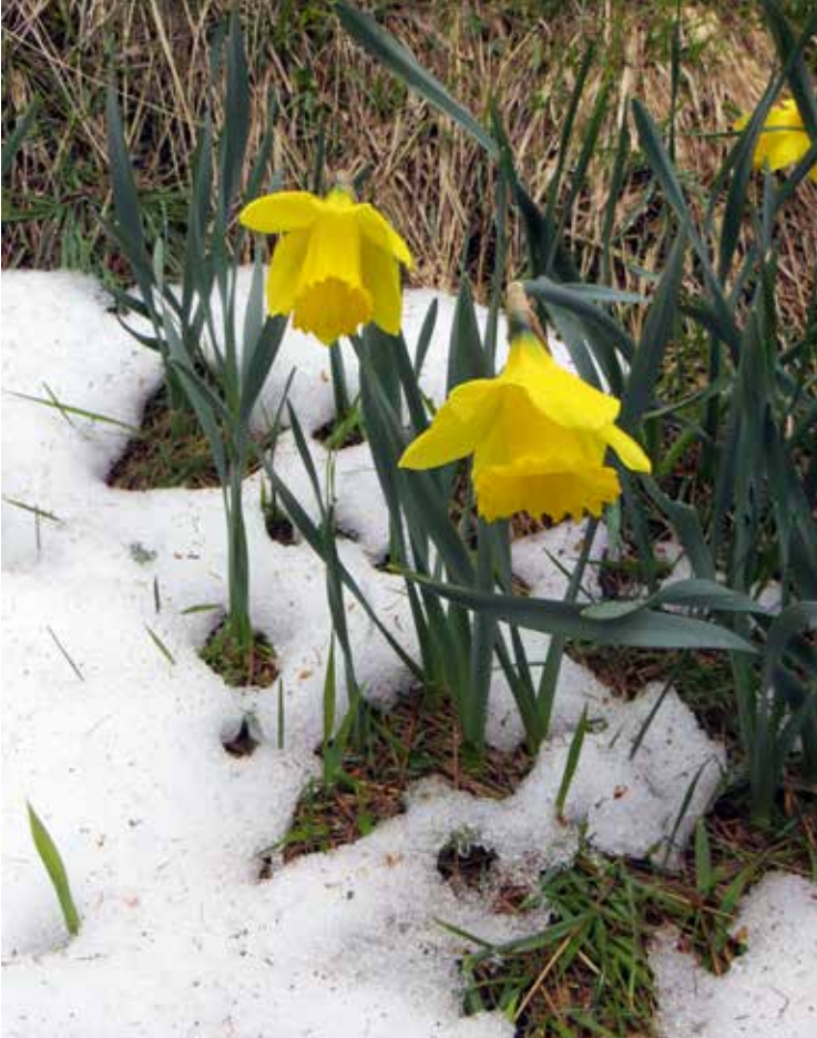
Rastemo na Psinjskem vrhu