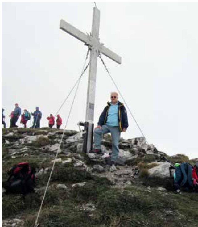
Na vrhu Ojsternika

Od planine Bistrizza* do parkišča smo se vračali po drugi poti mimo novo obnovljene planinske kočice Rifugio Nordio-Deffer. Staro zgradbo je 29. 8. 2003 uničil hudournik v katastrofalnem besu narave. Zelo lep ambient nove planinske kočice na višini 1400 metrov, ki jo upravlja Club alpino Italiano, Sekcija Trieste, je bil kot naročen, da smo v njem obnovili moči, ki so nam pošle na tem lepim izletu.