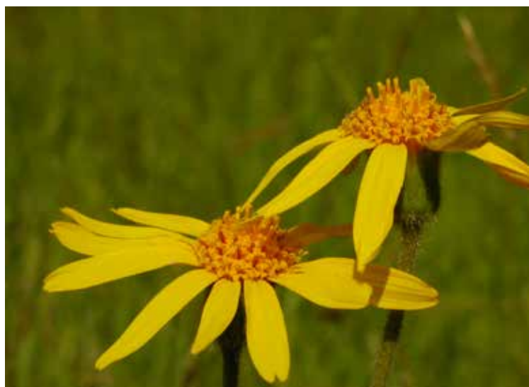
Arnica montana

In tu so možnosti, da našim zavarovanim vrstam rastlin, gliv in živali pomagamo. Zaposleni v parku in planinci se veliko zadržujemo na terenu in je zato verjetnost opažanja nedovoljenih posegov toliko večja. Kaj narediti ob taki priložnosti? Najbolj učinkovito je stopiti do storilca in ga opozoriti na nedopustnost takega početja. Seveda se takoj pojavijo pomisleki: saj me ne bo upošteval, lahko me celo fizično napade in podobno. Povsem razumljivo je, da bi ob takih pomislekih raje pogledal v stran in slabe volje nadaljeval svojo pot. Ampak ne! Svetujem, da skušamo biti pravi planinci z zdravim odnosom do narave in ukrepati. Če ni poguma za pristop, pa še vedno lahko zadevo dokumentiramo in sporočimo pristojnim. Saj imamo tako rekoč že vsi s seboj digitalne fotoaparate ali telefone s fotoaparatom – naredimo nekaj posnetkov ali celo filmček ter ga posredujemo društvenemu varuhu gorske narave ali zaposlenim v parku. Vsak tovrstni primer se potem hitro ustrezno obravnava, pa tudi v javnosti se o primeru razve in potencialnim bodočim kršiteljem da vedeti, da ljudem ni vseeno, da želimo ljudje naravo ohraniti. Že zato, ker imajo vse vrste enako pravico preživetja kot človek. In noben kupček evrov ne pretehta pravice po preživetju arnike, kosca, rogača ali katerega koli drugega bitja.