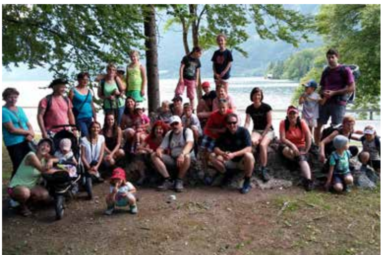
Na sprehodu ob jezeru