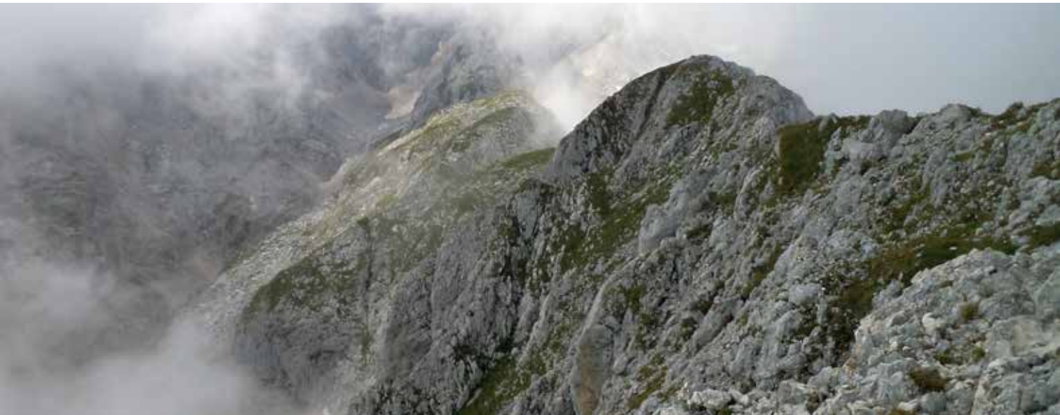
Mišelj vrh

Mišelj vrh je čudovita gora v samem središču Triglavskega narodnega parka. Nad Velim poljem se strmo dviga še kakih 700 metrov v višino. Velo polje je, kot ve vsak obiskovalec triglavskega pogorja, visokogorski planinski pašnik, na katerem se v poletnih mesecih pasejo črede goveda. Žvenketanje vratnih zvoncev je mogoče slišati na vrhovih okoliških gora.