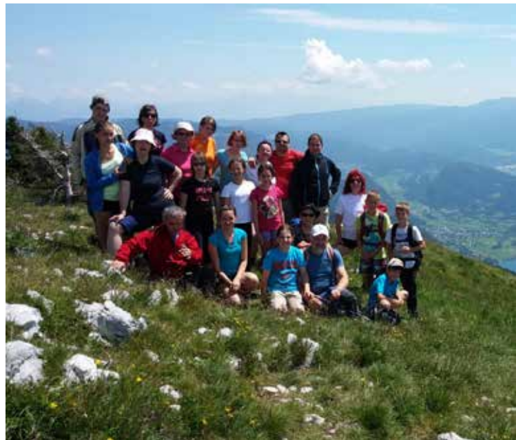
Na Peči