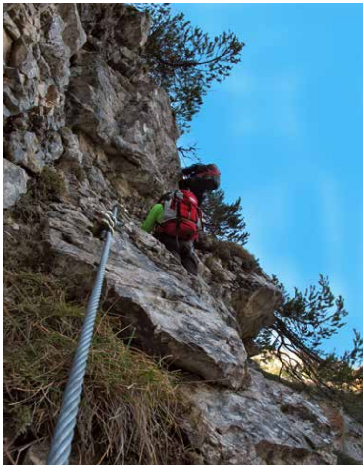
Zelo zahteven začetek

Ko smo po normalni poti sestopali, je bila ta najprej zasnežena in poledenela, spodaj v gozdu pa so stezo zapirala številna podrtá drevesa. Počasi smo se le prebili do avtomobila. Kmalu se nam je pridružil par iz Postojne, ki se je za nami vpisal v spominsko knjigo pod številkami 127 in 128. Danes nas je ferato splezalo pet, povprečje do tega dne pa je 11,18 plezalca na dan. »Norci,« smo si dejali in si zaželeli, da se še kdaj srečamo na kakšni podobni lepi, adrenalinski dogodivščini.