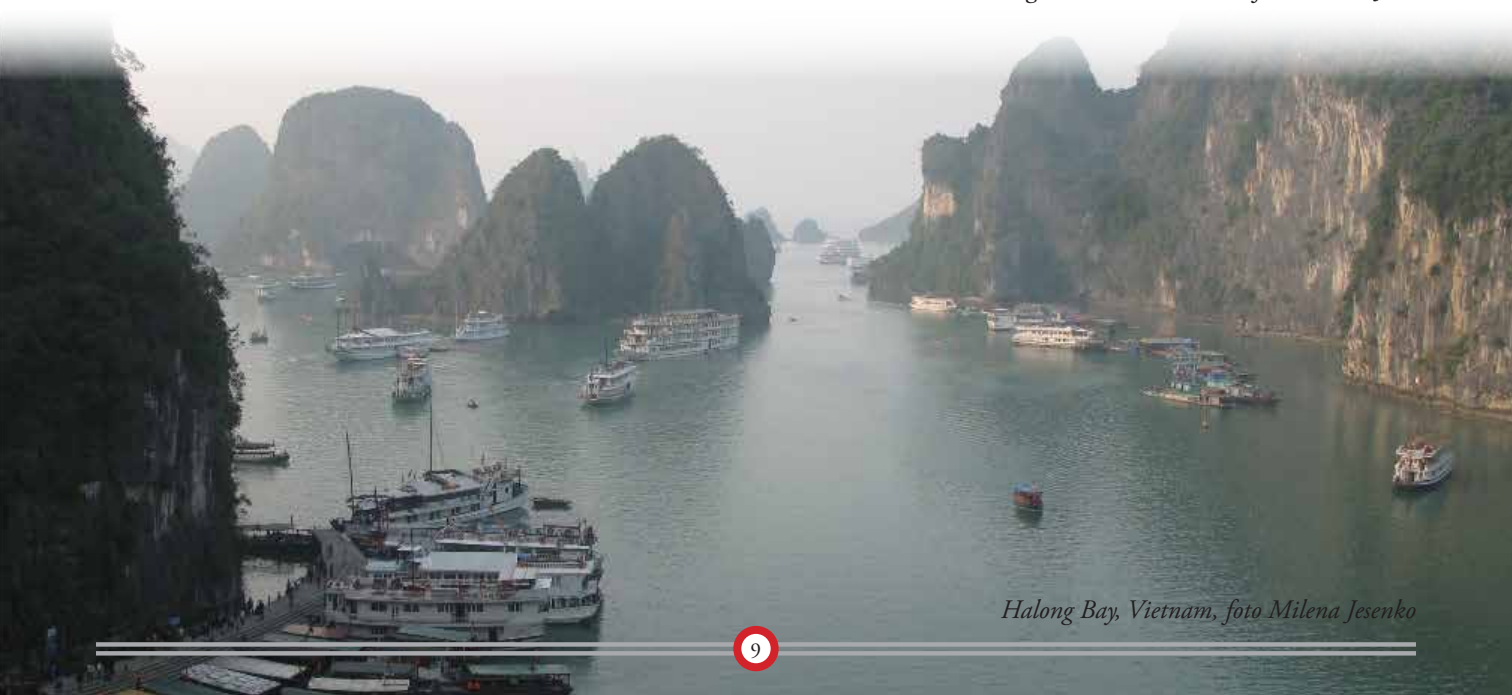
Halong Bay, Vietnam