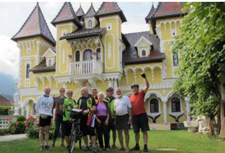
Grad Elberstein v Globasnici