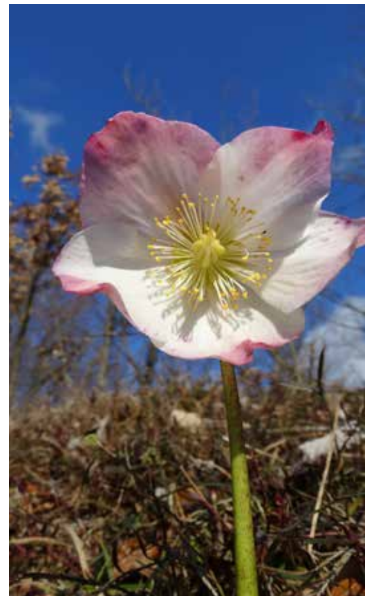
Heleborus Niger s Pustih ložc, foto Dušan Klenovšek