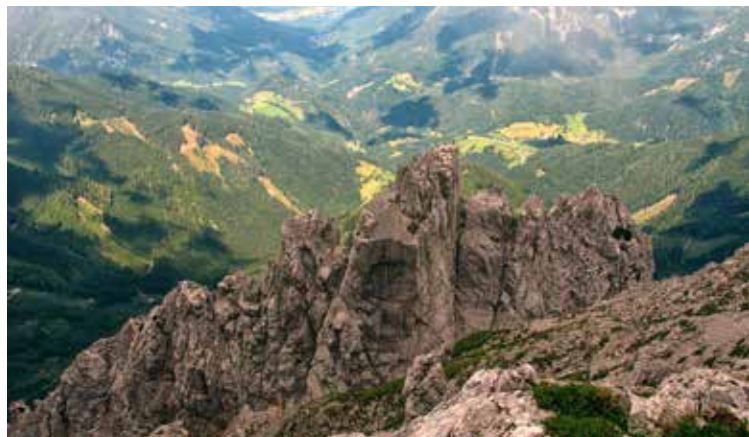
Cjajnik je najvišji vrh skalnega grebena