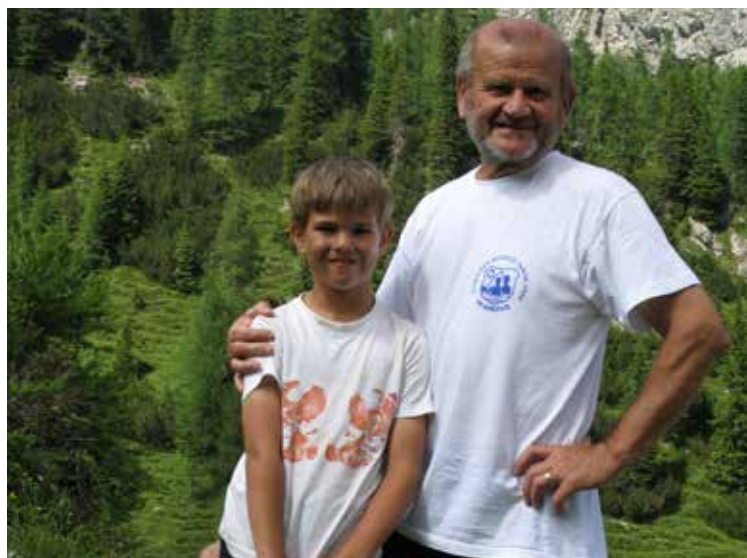
in dedka