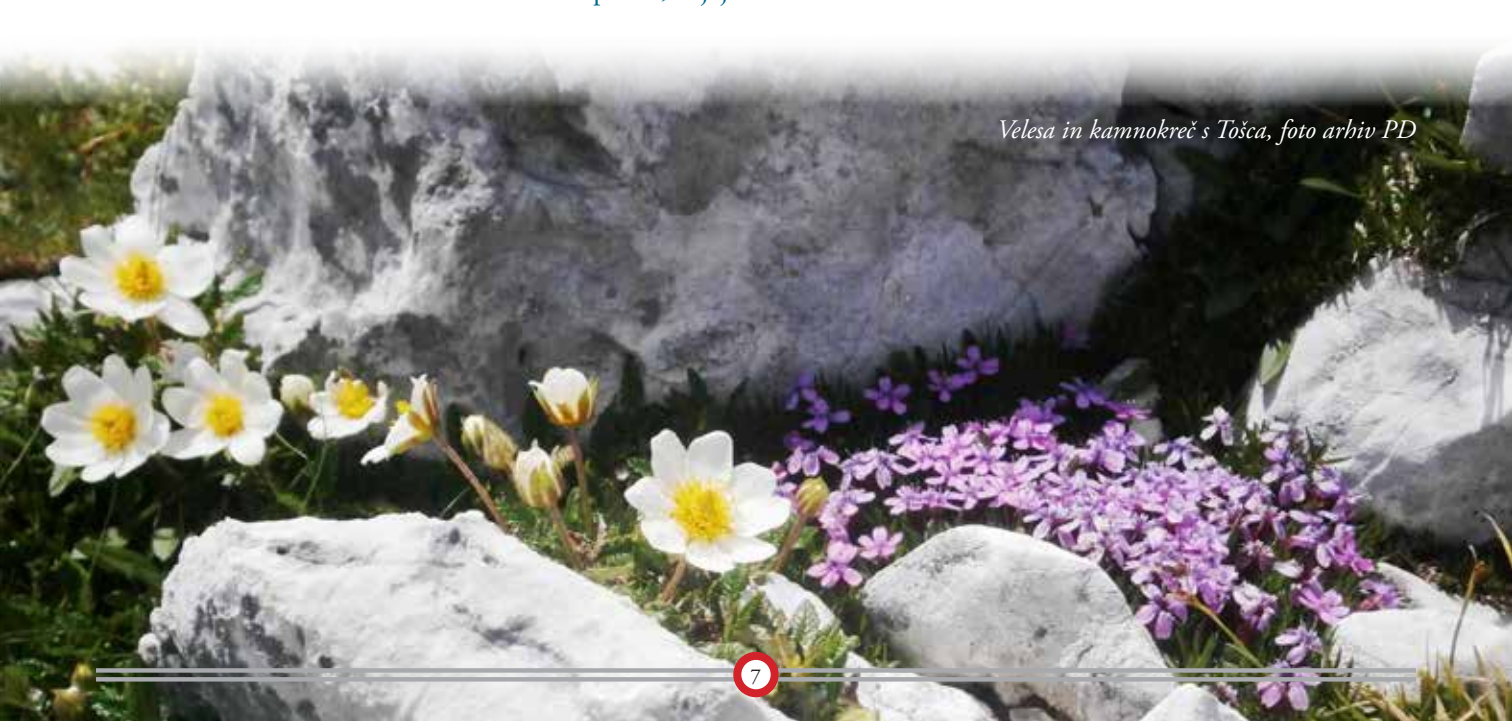
Velesa in kamnokreč s Tošca

Člani naravovarstvenega odseka se veselimo tudi naslednjih akcij in upamo, da bomo skupaj z vami skrbnejši do narave in da bomo k temu še vztrajneje spodbujali tudi druge. Varuhi narave smo lahko vsi, saj lahko vsak prispeva bodisi v svojem domačem okolju ali pa nekoliko višje v gorskem svetu, da ohranimo nekaj tistega lepega, cvetočega ali dih jemajočega, kar se je še uspelo skriti pred težo negativnih človeških dejanj.