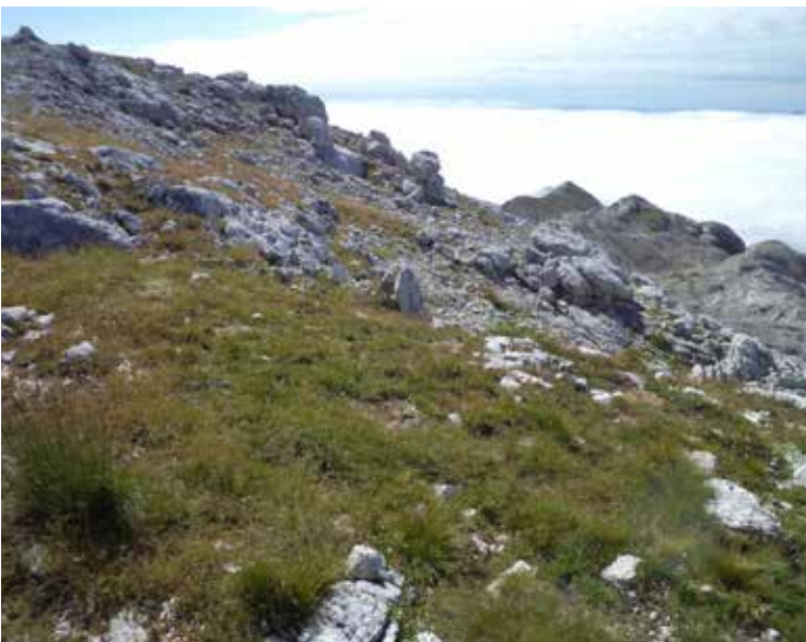
Pogled z Debelega vrha