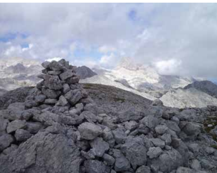
Na vrhu Debelega vrha