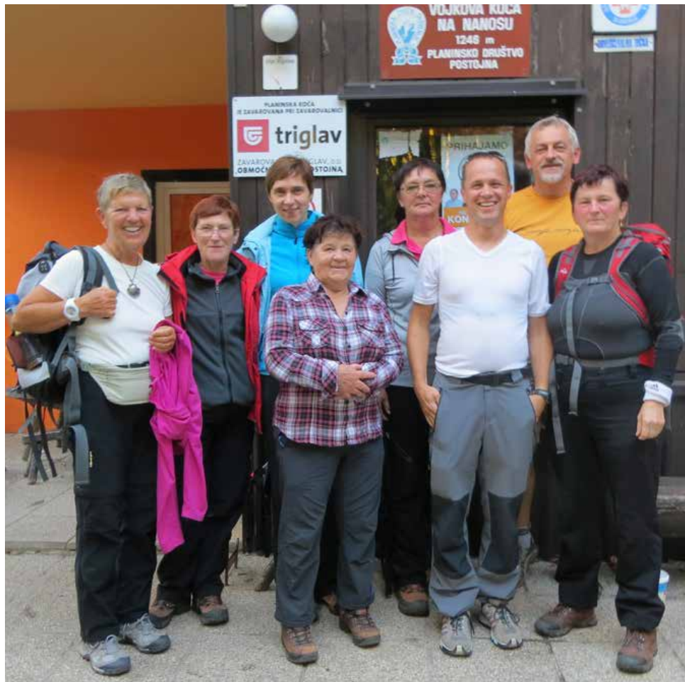
"Šolarji" na Nanosu, foto Danica Fux

Teste, ki so jih pripravili predavatelji, smo uspešno rešili že v mesecu januarju. Slušatelji so pokazali izredno