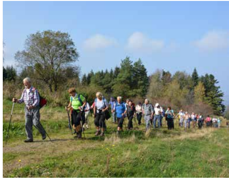
Proti Sljemenu

Nazaj po sončni strani pa čez Premagovce. Spet smo vsi pri sodu zbrani, za konec si pomahamo v slovo, novo leto 2015 naj srečno bo!