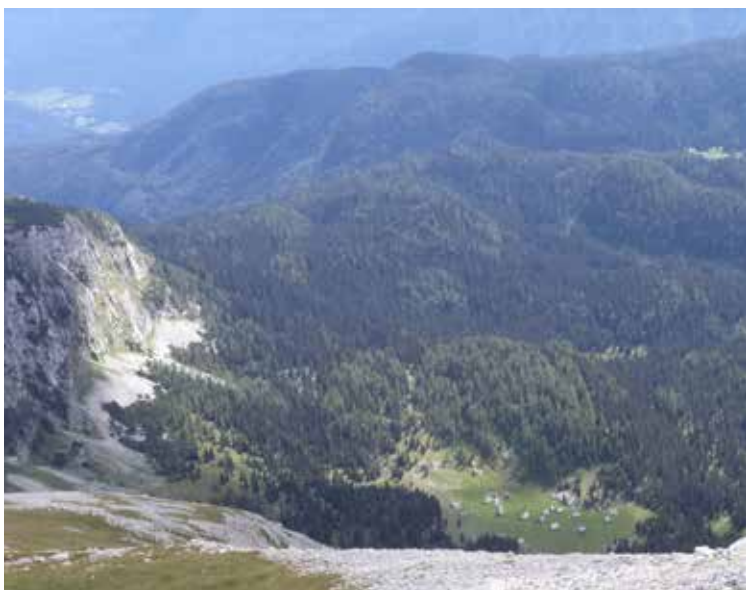
Stani na planini V lazu