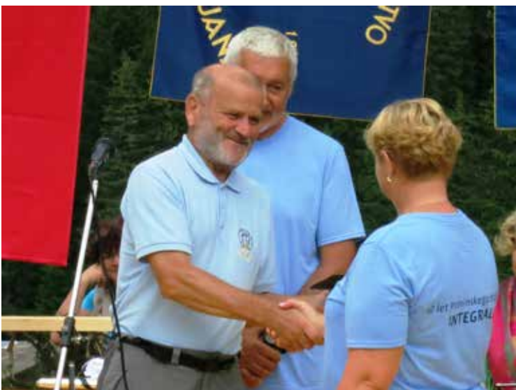
V vlogi podpredsednika PZS...