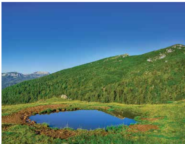
Pogled na Malo in Veliko Raduho, foto Urška Korun

Meglice in vsakdanje skrbi sem pustila spodaj v dolini, vrhove obsevajo prvi sončni žarki in v zraku se pretaka čudovita tišina jutra, napolnjena s svežino gorskega zraka in z vonjem po borovcih. Rada grem v hribe z dobro družbo, vendar je posebno doživetje, če se podaš nanje sam. Biti sama z naravo, gorami, skalami, živalmi. Tako prvobitno, divje in čudovito je to. Vselej si z užitkom utrgam dan zase. Psihično in fizično se nanj pripravim že dan prej. Preverim opremo, pripravim nekaj za pod zob in še enkrat pokukam na internet za vremensko napoved. Rečem si: »Vse je OK, gremo spat!« Sredi noči me vrže pokonci alarm, na hitro se oblečem, pripravim, preverim