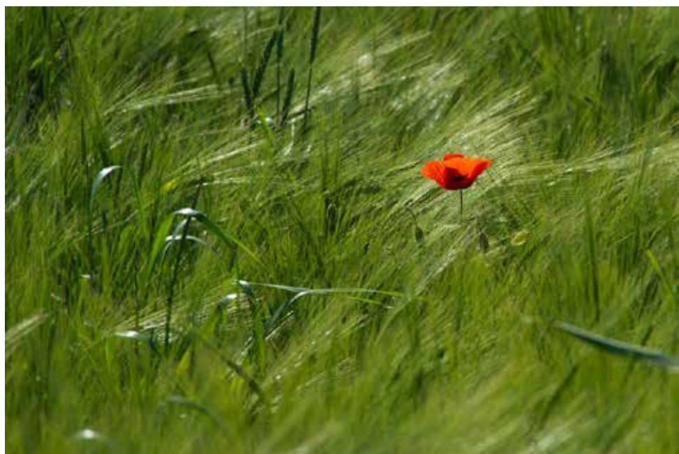
Sam v zelenem