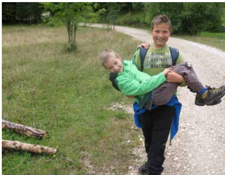
Lepše se je nositi kot hoditi

Na lepo junijsko soboto, 14. 6. 2014, smo se skupaj s starejšimi planinci iz PD Brežice odpravili v Bohinjsko Bistrico. Ta dan je bilo možno izbirati med več turami. Mi smo se odločili za Rudnico, ki leži sicer malo nižje od 1000 m, a pot do vrha ni bila tako lahka, ker je bilo na njej veliko podrtega drevja. Na vrhu nas je čakala še pripovedka o škratu. Ko smo prispeli nazaj v dolino, smo poslušali slavnostno prireditev ob DNEVU SLOVENSКИH PLANINCEV. Zdaj že vemo, da moramo vstati, ko zaslišimo planinsko himno Oj, Triglav, moj dom. Potem smo se preizkusili še v vožnji z gorskimi kolesi, na plezalni steni in na igralih. Preživeli smo prelep aktiven dan.