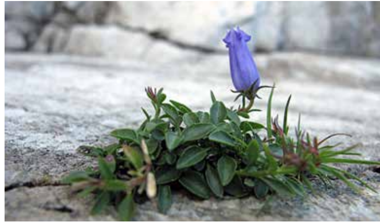
Zoisova zvončnica

Sam sem prepričan, da bi naslednji vzpon na Cjajnik potekal povsem drugače. Prvič ne veš točno, kaj te čaka, zato je psihični pritisk dosti večji.