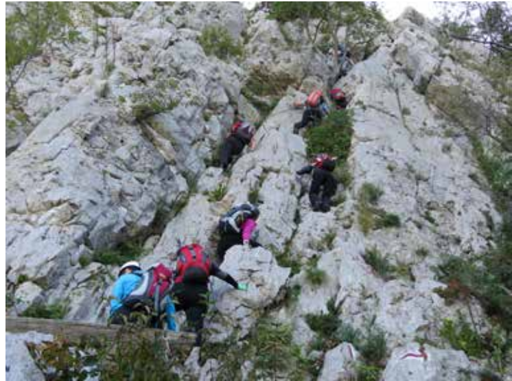
Navzgor, navzgor ...

Po okroglo enem letu listam po zapiskih in skušam strniti vtise iz končane planinske šole 2013/14. Saj ne da bi vse skupaj trajalo tako dolgo, a najbrž je prav, da se z Božičkovo kapo na glavi na vse skupaj ozrem iz določene časovne oddaljenosti.