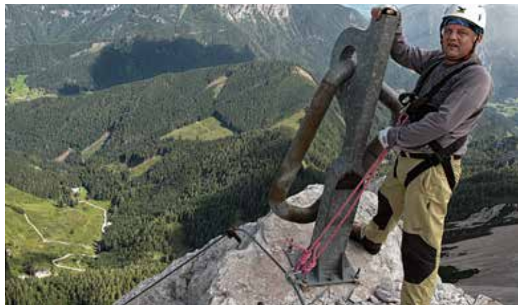
Na vrhu Cjajnika, foto Ivan Tomše