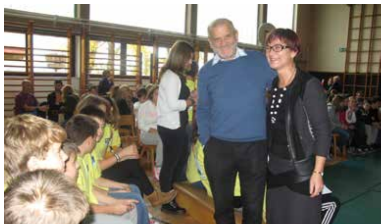
Tudi ravnateljica je spodbujala svoje učence, foto arhiv PD

Ekipe OŠ Cerklje ob Krki z mentorico in predsednikom PD, foto arhiv PD