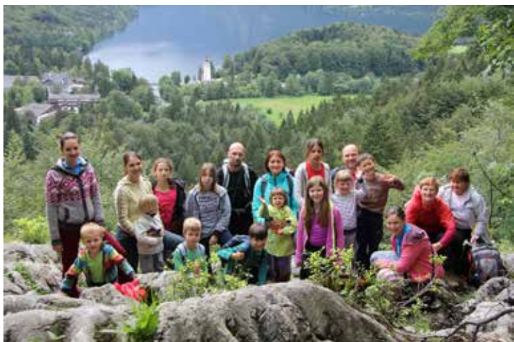
Planinski tabor 2014

SALDO NA TRR 31. 12. 2014 ..... 3.931,51