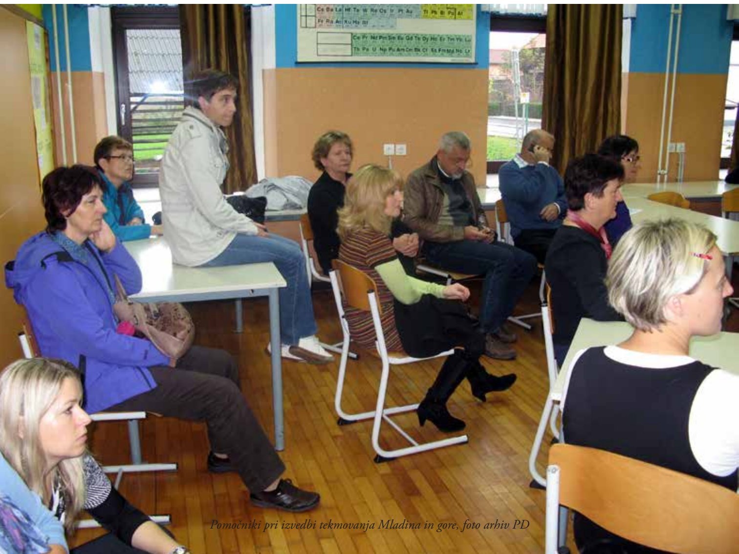
Pomočniki pri izvedbi tekmovanja Mladina in gore