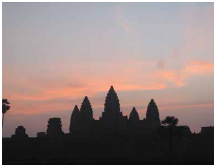
Angkor Watt, Kambodža