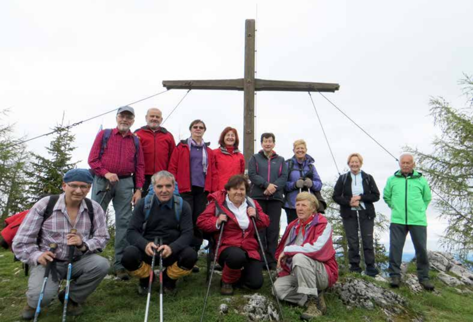
Psinjski vrh