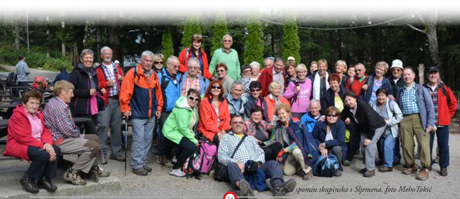
Za spomin skupinska s Sljemena

Planinski tabor, dež. Kaj početi? Vodja tabora: »Otroci, narišite katerokoli žival, ki ste jo videli v planinah.« Otroci rišejo, Janezek prvi odda list, a na njem ni nič. »Kaj je to, Janezek?« »To je slika krave, ki je travo na pašniku.« »Jaz ne vidim nič. Kje je trava?« »Ja, krava jo je pojedla.« »In kje je krava?« »Odšla je, ker ni imela več kaj jesti.«