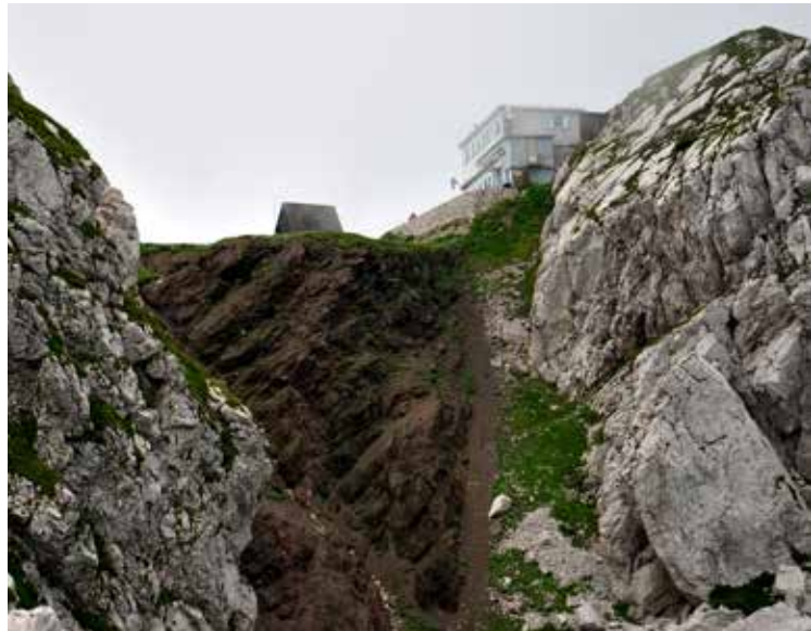
Koča na Črni prsti