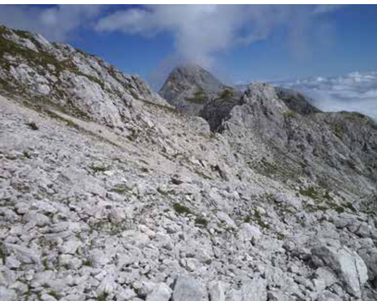
Pot na Mišelj vrh pelje po grebenu