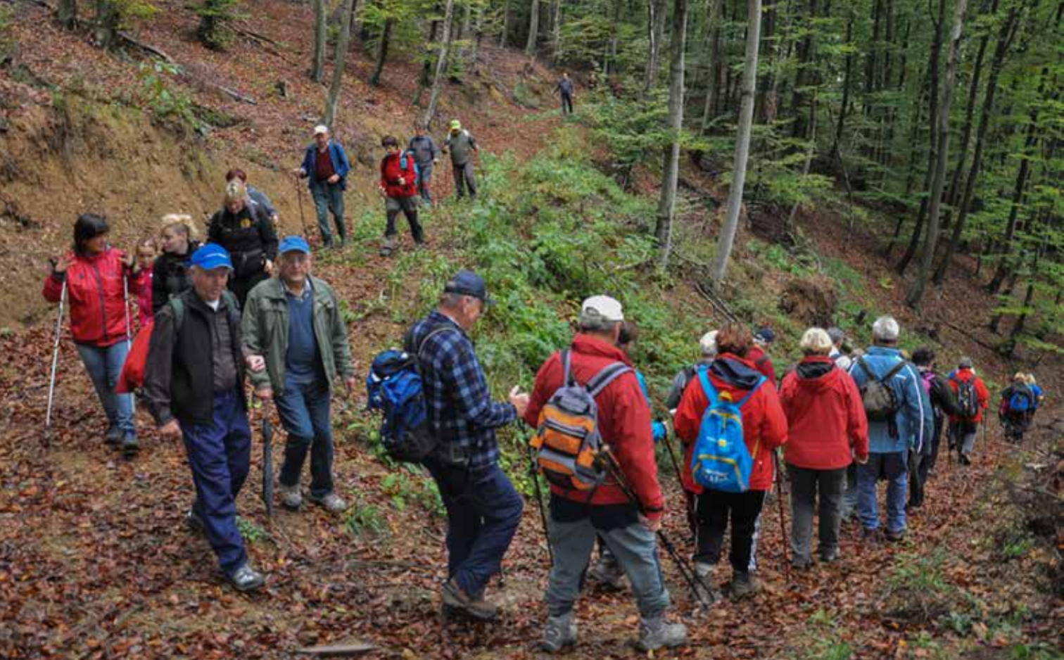
Po poteh Brežiške čete