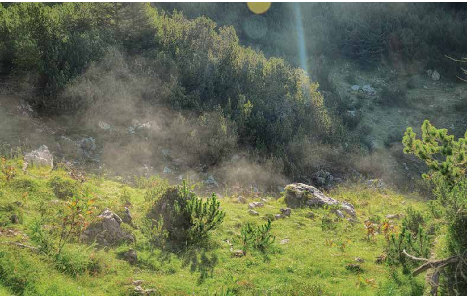
Jutranje meglice na Lanežu

»Slovenci veljamo za športno izobražen narod. Najpomembnejši pokazatelj za upravičenost tega naziva je čim večje število državljanov, ki se kolikor toliko redno ukvarjajo z gibanjem. Planinska zveza Slovenije in njeni člani smo brez dvoma najboljši dokaz te izobraženosti, saj poleg gibanja, tako pomembnega za človekovo dobro počutje in zdravje, promoviramo še druge pomembne vrednote: potrpežljivost, vztrajnost, predanost, pomoč sočloveku, varovanje in ohranjanje narave. Te univerzalne vrednote so nam skupne, ne glede na kakšen način zahajamo v gore. Kot pohodniki, planinci, gorniki, turisti ali alpinisti. Med nami ni razlik. Morda so naše poti po gorah različne, a doživetja nas družijo ...«