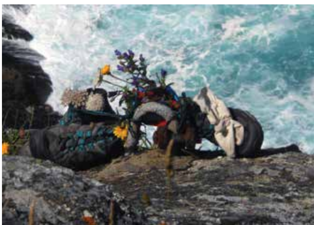
Čevlji so ostali na obali Atlantika

z urejanjem, razgibavanjem, zajtrkom in pred sedmo uro sva bili že na poti. Razen mojih bolečih in otečenih nog v prvem tednu hoje drugih zdravstvenih problemov nisva imeli. Po prehojenih 25 do 35 kilometrih oziroma po šestih do devetih urah hoje sva poiskali prenočišče (alberg), se prijavili, žigosali, tuširali, masirali, prali in sušili perilo, nato pa poskrbeli za hrano. Popoldne sva si ogledali okolico in znamenitosti ter načrtovali etapo za naslednji dan. Andreja je izbrala vsako možnost za internetno povezavo z najbližjimi domačimi in jih obveščala o najinem napredovanju. Sama pokrajina je bila čudovita, polna cvetja, na še tako majhnem hribu se je obračala cela veriga vetrnic. Lepo urejeni vrtovi, kamnite hišice, štirinožni prijatelji in prijazni domačini so nama vedno znova popestrili pot.