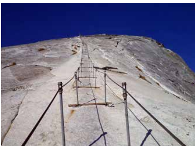
Pot z jekleno vrvi na vrh gore Half Dome

Potem mi je končno neki pohodnik svetoval, naj zaprosim za dovolilnico za taborjenje. Te so bile še vedno na voljo, saj je zaradi gozdnega požara v bližini mnogo ljudi odpovedalo svoj prihod. V petek sem ob 3. uri popoldne prikorakal v pisarno Centra za divjino v dolini Yosemite in ranger mi je dejal, da je na voljo samo še ena dovolilnica. Po srečnem naključju sem tako dobil dovoljenje za vzpon na Half Dome za nedeljo, 15. septembra.