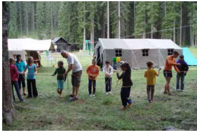
Planinski tabor na Pokljuki