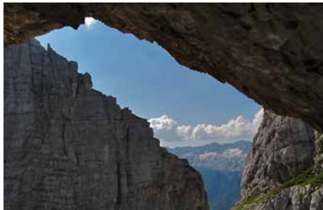
Pogled iz lope z vpisno knjigo na strme stene Zabuša in Kaninsko pogorje

Na škrbini Viene je opozorilna tabla, da je pot 640 zaprta. Za naju, ki sva po tej poti prišla, je bilo to sporočilo brez pomena. Hodila in plezala sva torej pod »prekrškom«, vendar v popolni nevednosti, saj bi moralo opozorilo biti