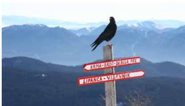
Na straži

Za delo v preteklem letu se najiskrenejše zahvaljujem vsem našim prostovoljcem - članom upravnega in nadzornega odbora, vodjem odsekov, sekcij, odborov, skupin in praporščakoma. Zahvala pa gre tudi vam, spoštovani planinke in planinci, saj smo le skupaj lahko uresničevali program društva, negovali vrednote planinstva, skrbeli za promocijo zdravega načina življenja in krepitev skrbi za neokrnjeno naravo.