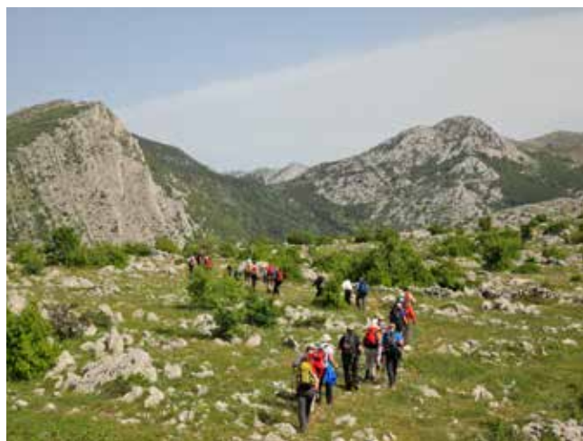
Po Velebitu

Preživeli smo dva prekrasna planinska dneva, zahvaljujoč obema društvoma. Kadar smo s PD Zavod za zdravstveno varstvo Celje, nastanejo čudovite dogodivščine in posledično še lepši spomini. Sama sem uživala ves čas in se že veselim ponovnega srečanja.