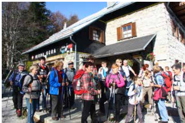
Na Mirni gori