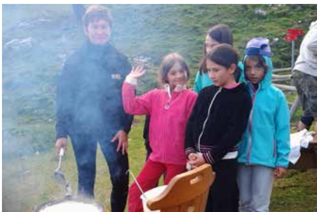
Kaj kuba Nuša?

Tabor je potekal tako, kot smo si zastavili vsebino, vreme nam je služilo, večjih poškodb ni bilo. Prvi dan smo si ogledali planšarijo in planino Vodol, drugi dan smo se povzpeli na vrh Raduhe, tretji dan smo bili v Snežni jami in na orientacijskem