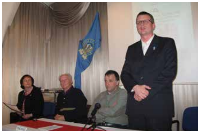
Predsednik PZS ob 60-letnici SPP

Člani UO so se udeleževali planinskih večerov, o katerih poročata v nadaljevanju vodji.