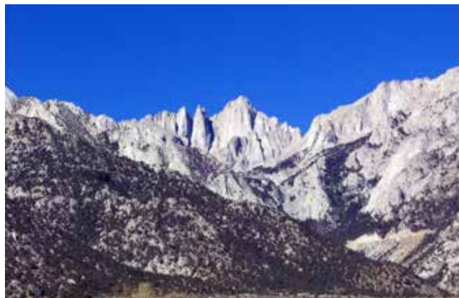
Gora Whitney (na sredini slike) je s 4421 m najvišja gora v celinskem delu ZDA

bil videti zaskrbljen, saj sem bil jaz najin vodja. Uspelo se mi je splaziti nazaj na pot in nekako sva prispela do parkirišča. Skupaj sva spila pivo, potem pa šla naprej vsak po svoji poti. Odpeljal sem se v hostel Lone Pine, kjer sem spal celih 10 ur. Naslednjega dne sem se počutil veliko bolje – višinska bolezen je izginila in spet sem lahko hodil vzravnano, brez bolečin. Zvečer sem se že vrnil v San Diego.