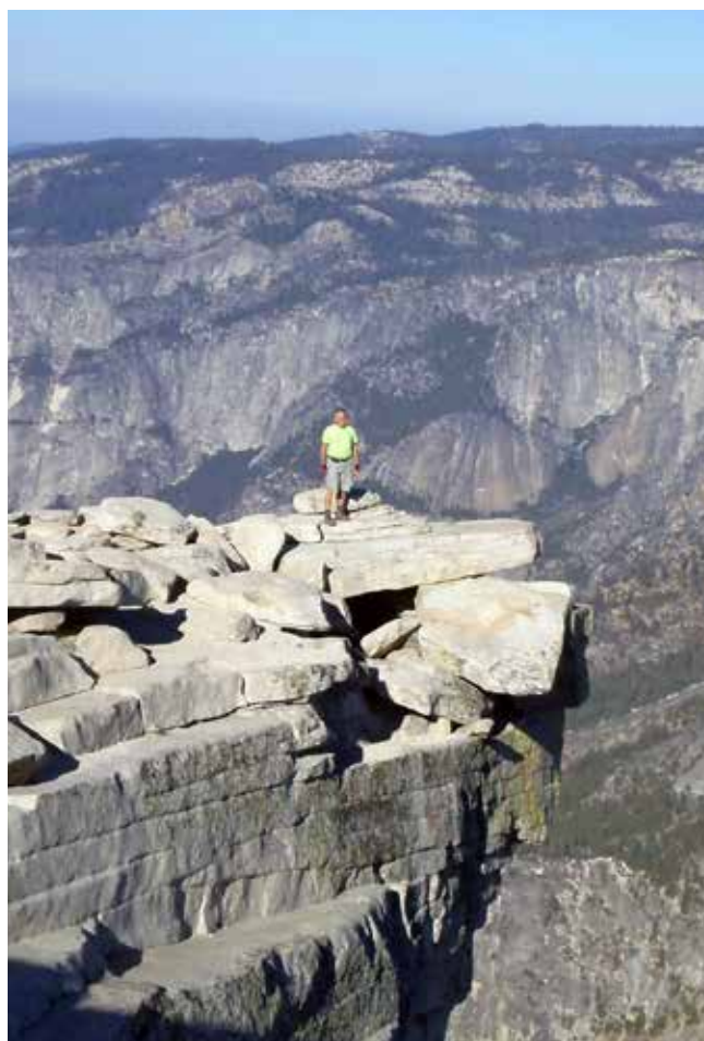
Na vrhu gore Half Dome, pogled levo na goro El Capitan

Nato me je pot vodila navzdol po jeklenicah in stopnicah do vznožja Sub-Dome, kamor je prispel ranger, ki je preverjal dovoljenja s pomočjo prenosnega računalnika. V treh urah in pol sem bil nazaj pri avtu – celoten pohod mi je vzel le osem ur. Napolnjen z energijo gore sem prevozil še osem ur poti nazaj do San Diega, kjer sem nedeljsko noč prespal v udobni postelji v hčerkinini hiši. Naslednji teden sem se z letalom vrnil domov v prelepo Slovenijo.