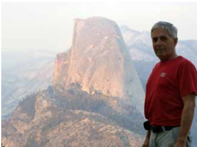
Half Dome (2693 m) je simbol Doline Yosemite, Kalifornija.

Smer ob jeklenicah na Half Dome vsako pomlad in zimo postane alpinistična smer, potem ko odstranijo jeklene vrvi. Od konca maja do sredine oktobra, ko so na pobočju nameščene jeklene vrvi, pa je enodnevni izlet na Half Dome bistveno lažji od enodnevnega vzpona na Triglav. Half Dome je nižji od Triglava (2693 m proti 2864 m) in tudi sprememba nadmorske višine na poti na Triglav je večja (1800 m v primerjavi s Half Dome, ki je 1450 m). Pohodniška pot iz doline Yosemite do vrha Half Dome in nazaj znaša 25 kilometrov, podobne dolge so tudi nekatere poti na Triglav, primerljiv je tudi čas, ki ga potrebujemo za vzpon na vrh – približno šest ur.