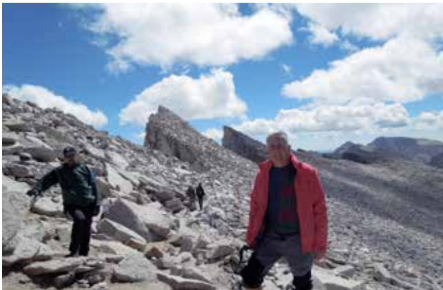
Pot na nadmorski višini 4300 m

Zahodno gorovje s položnejšimi pobočji, ki se spušča proti Pacifiku, je erodiralo in ustvarilo globoke doline, kot sta dolina Yosemite in Kraljevski kanjon (King's Canyon). Bogata prst, ki jo je nanosilo s teh planin, je ustvarila eno kmetijsko najbolj razvitih regij na svetu – Kalifornijsko dolino (California's Central Valley) –, kjer pridelujejo veliko sadja, oreščkov in zelenjave za potrebe Združenih držav.