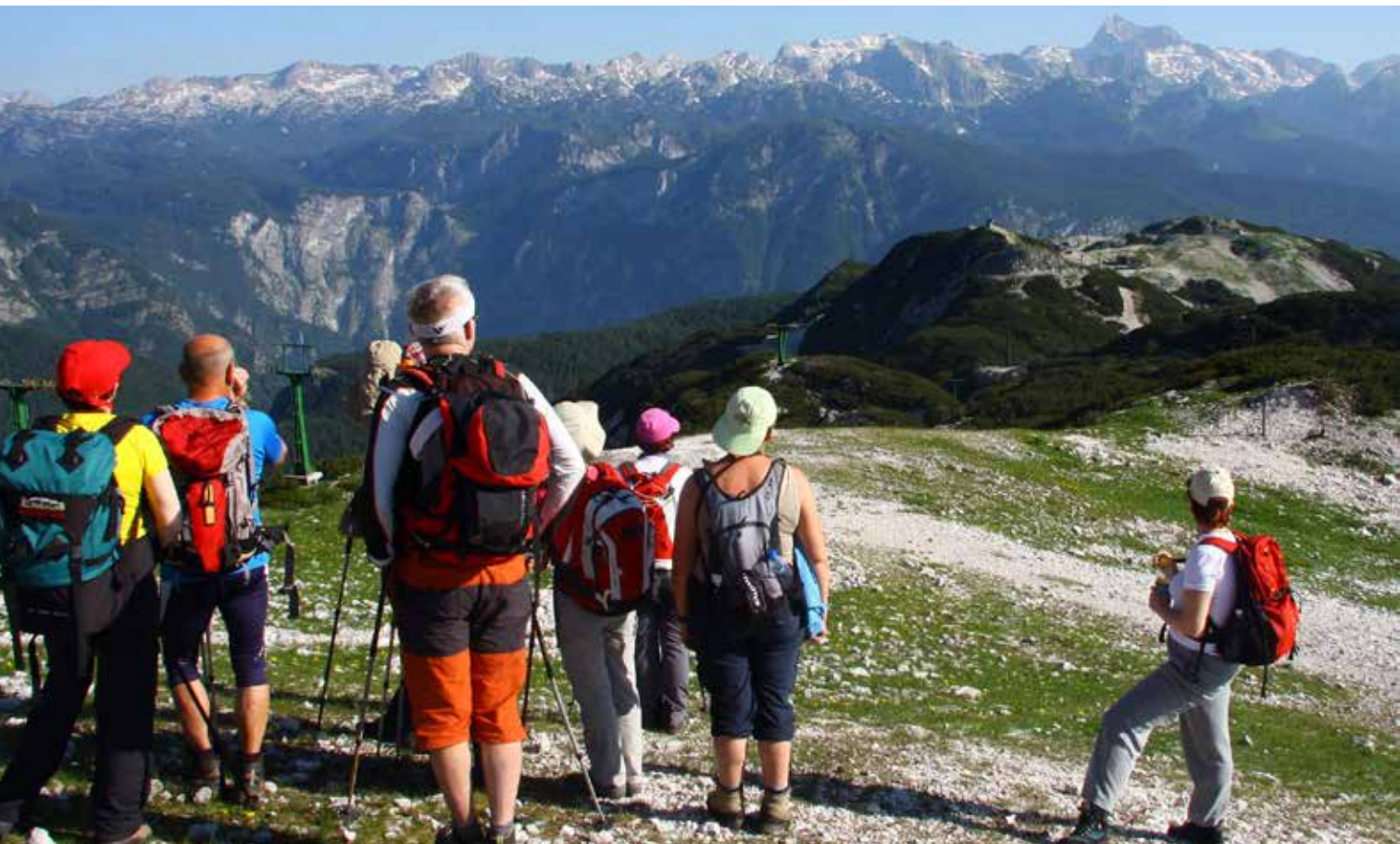
Razkošje pogledov