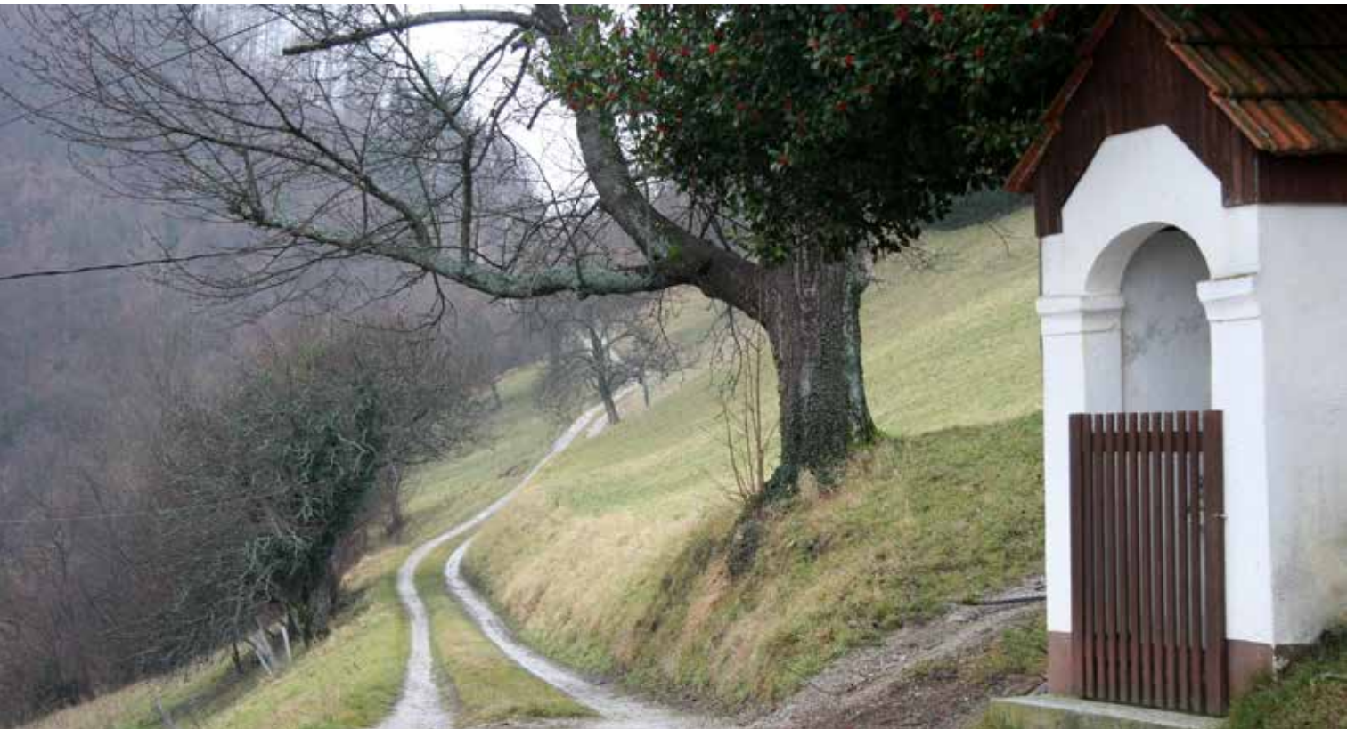
Pot na Kum