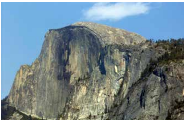
Half Dome (2693 m) je simbol Doline Yosemite, Kalifornija

Nacionalni park Yosemite v Kaliforniji je eden izmed treh najbolj priljubljenih nacionalnih parkov med vsemi 59 parki Združenih držav Amerike. Nahaja se v 560 km dolgem granitnem gorovju Sierra Nevada v vzhodni Kaliforniji.