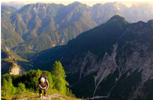
Pogled nazaj v dolino Dunje

Planinci zagotovo vemo za dve znameniti gori v Zahodnih Julijcih. Montaž ali Poliški špik, ki mu Italijani pravijo Jof di Montasio (2.753 m), je najvišji vrh skupine, ki se s svojimi strmimi stenami spušča v doline Reklanica, Zajzera in Dunja. Na gori so številne police, strmali in grape, ki omogočajo izurjenim gornikom uživaško plezanje, nekoliko manj sposobni pa se na vrh praviloma podajo s planine Pecol.