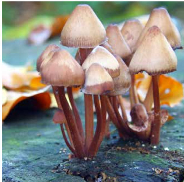
Rastemo iz štora

Zvedeli smo marsikaj o gozdnih sadežih. Za zaključek pa nas je gostoljubno sprejela družina Senica.