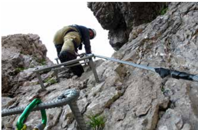
Skobe na poti Norina

nahrbtnika, nato pa je še sam priletel na drugo stran. Reka je bila tako ukročena, vzela pa je nama kar nekaj časa.