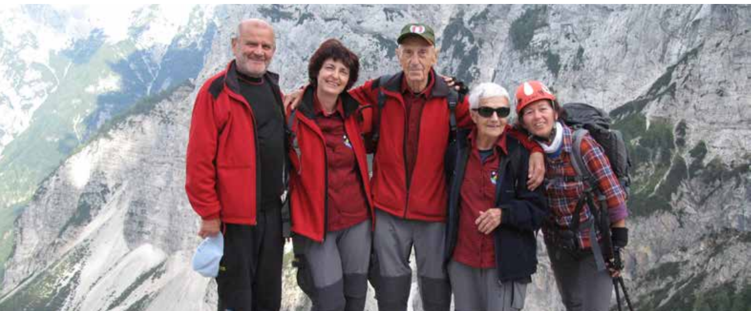
Vršič - delegacija PDB na 60-letnici PD PT

V letu 2013 nabav nove planinske opreme zaradi pomanjkanja denarja ni bilo. Je pa MO PD Brežice od Adija Broda prejel donacijo električne omarice z varovalkami in kabli, kar potrebujemo v planinskih taborih.