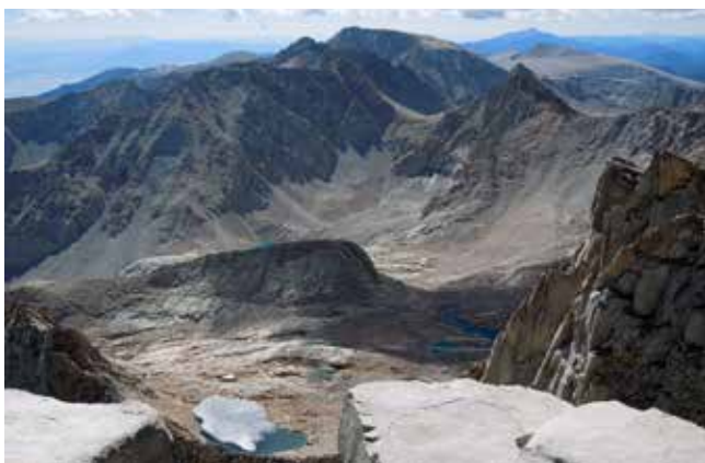
Iz vrha gore Whitney se na vzhodu razprostirajo nekateri od 150 gorovij in dolin vzhodne Kalifornije, Nevade in Utaha.

V letošnjem septembru sem obiskal hčerko v San Diegu, v Kaliforniji, kjer sem preživel tri tedne. Preden sem zapustil Slovenijo, kjer živim že 14 let, sem se odločil, da se bom povzpел na goro Whitney, ki leži 450 km severno od San Diega.