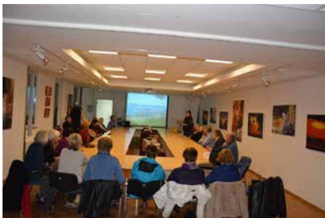
Planinski večer

Potujte. Ne le da bi nekam prišli, temveč da bi veliko doživeli. Uberete lahko uhojene steze ali odkrivete nove pristane in srečujete nove, nepoznane ljudi. Ti bodo razširili vaša obzorja in vam dali priložnost za drugačen vdih.