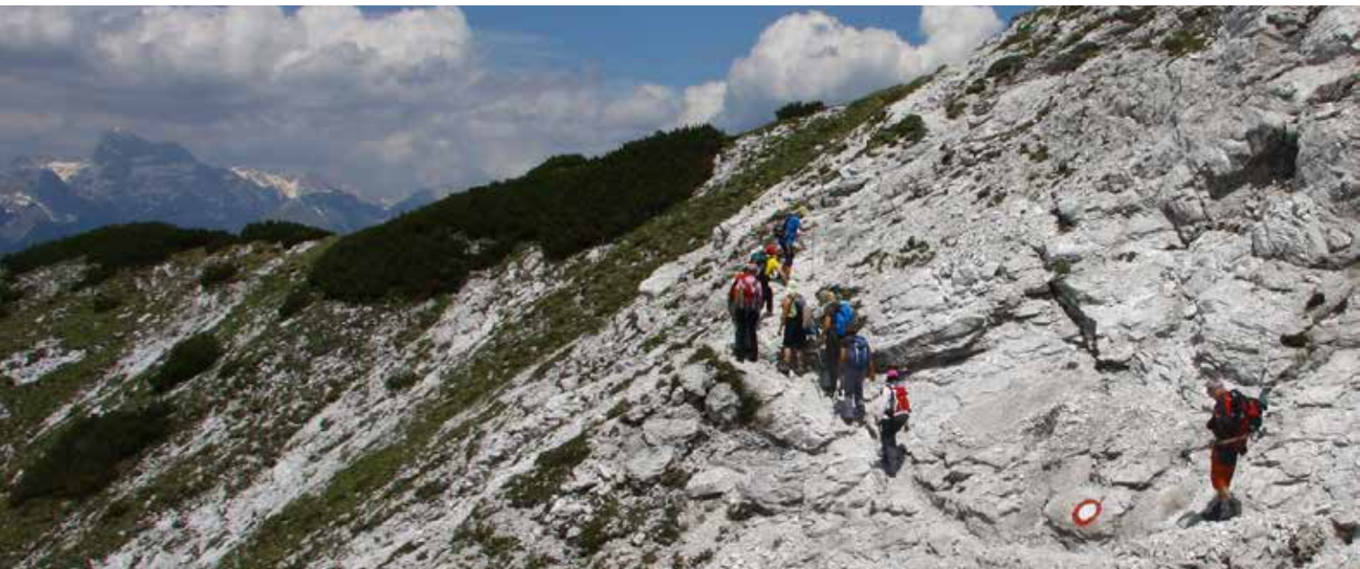
Z Vogla na Črno prst