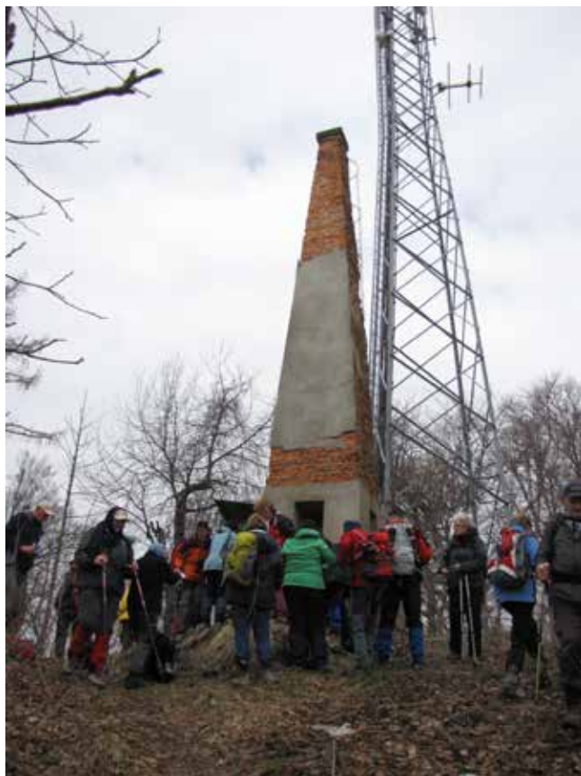
Na vrhu Grmade, 462 m

Slovenjegoriška planinska pot je dolga 93 kilometrov in poteka po Srednjih Slovenskih gorah ter delu Ptujškega in Dravskega polja. Prične se v najstarejšem slovenskem mestu Ptujju ter poteka čez Vurberk, skozi Trnovsko vas, Vitomarce, Juršince, Polenšak, Gorišnico in Markovce nazaj v Ptuj. Na poti je 12 kontrolnih točk z žigi, ki jih je treba odtisniti v dnevnik. Obstajata pa tudi posebna zloženka in vodnik z opisom poti in znamenitosti krajev ob poti.