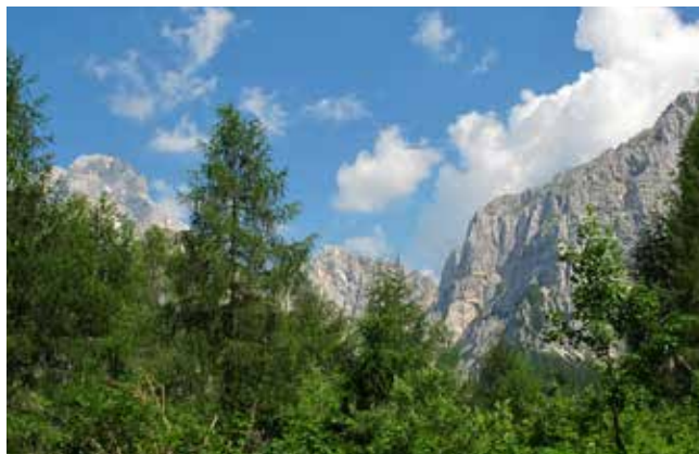
Z leve Montaž, Zabuš, Sedlo Viene in greben Strme peči

Pot Norina na Strmo peč me je navduševala že kar