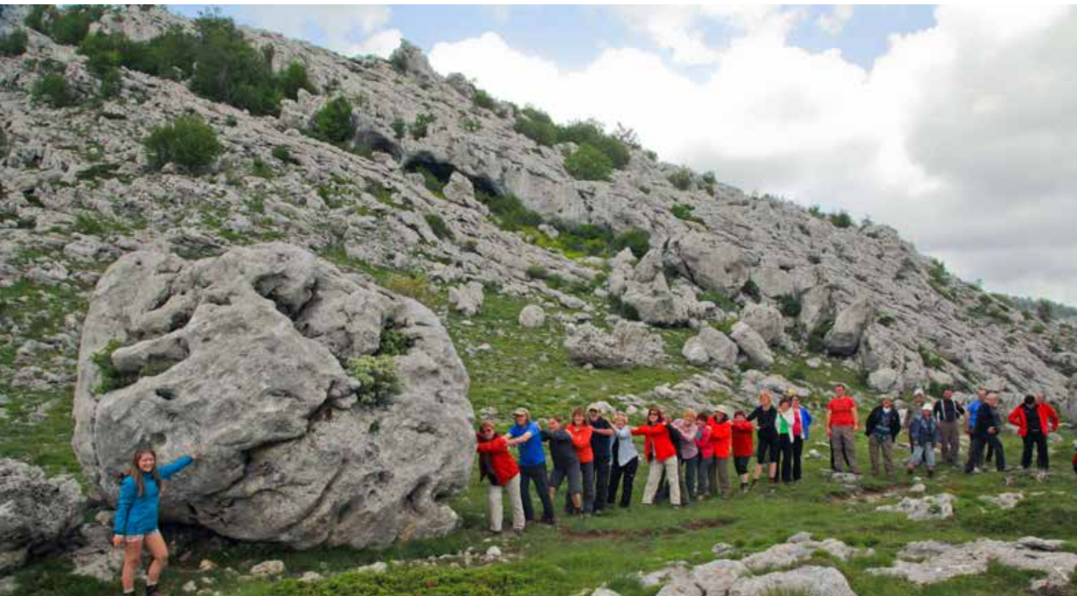
Kdo bo močnejši?

Da bi se dalo priti do zadnje dvorane, bi morali porušiti preveč kapniških stebrov. Tretjo dvorano so poimenovali Katedrala, ker je v njej zelo dobra akustika, kapniki pa spominjajo na mogočne orgle. Še ena zanimivost jame je: ima samo en vhod, ki je hkrati tudi izhod.