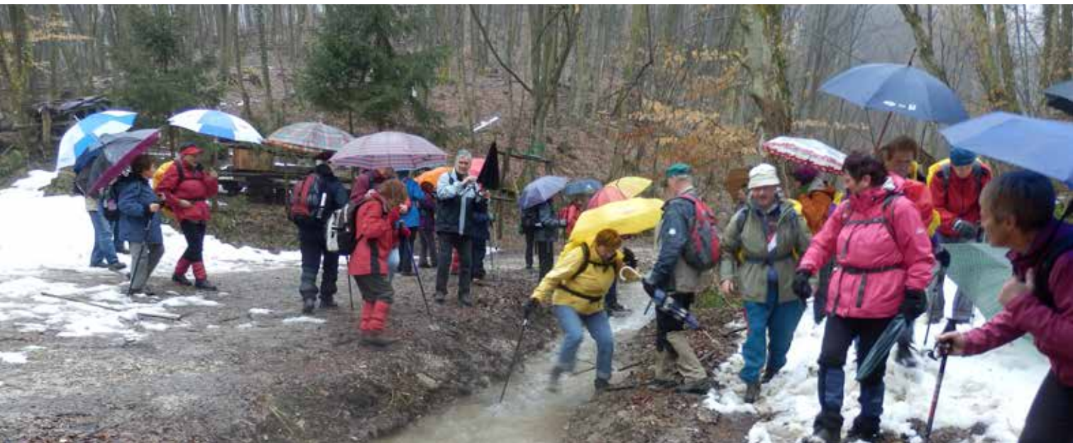
Torkarji se ne bojijo vode