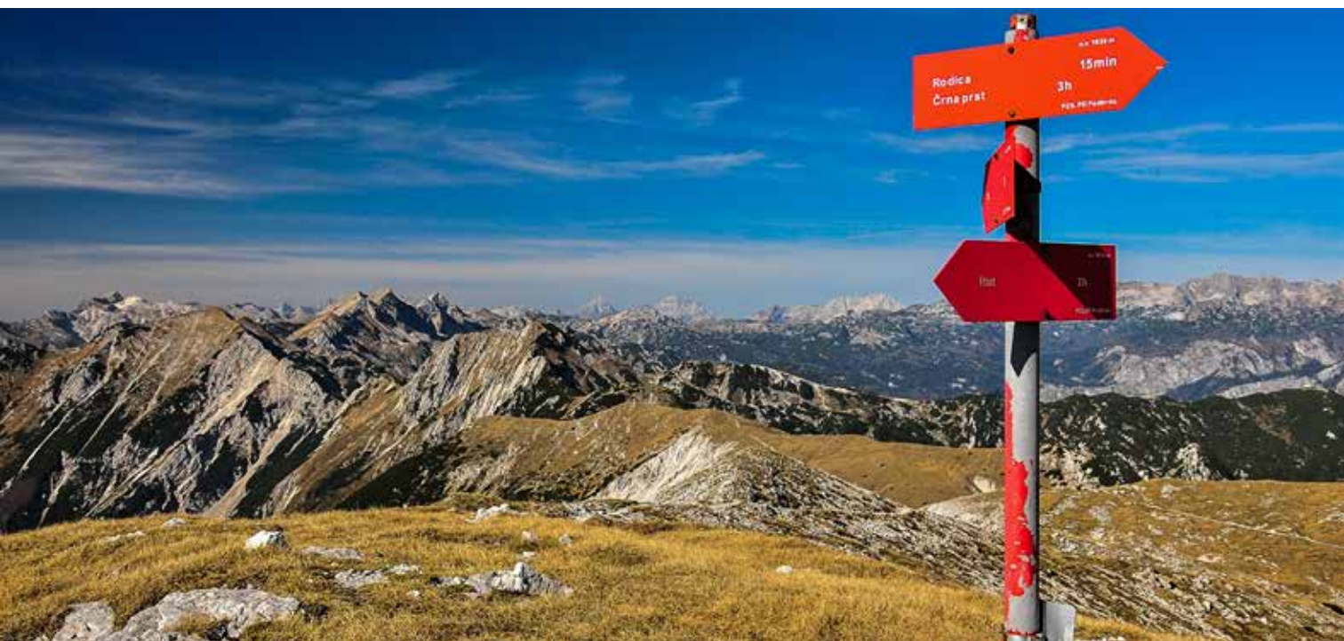
Pogled na Šijo in Dolomite

Tabor je sicer po mnenju udeležencev potekal v redu. Ker pa sem se odločila, da drugo leto dopust izkoristim izključno z družino, ne bom mogla biti vodja naslednjega družinskega tabora. Predlagam, da PD pravočasno najde zamenjavo.