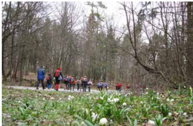
Tudi kronice že cvetijo

Frida, hvala, da si me zbezala na to pot. Imela sem se prekrasno, se v naravi popolnoma sprostita in si nabrala novih moči za študij!