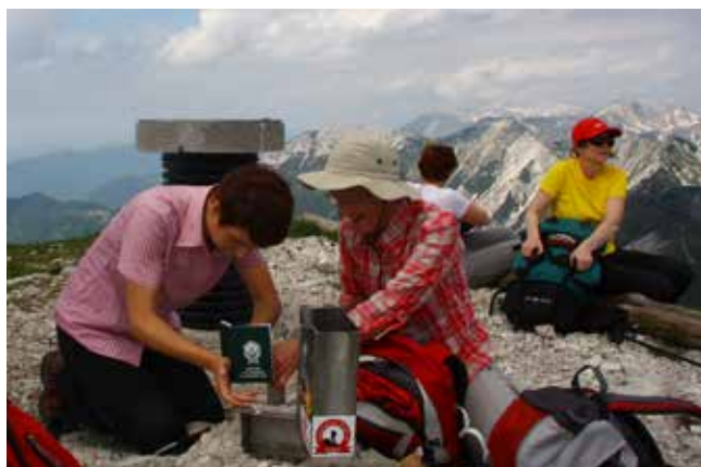
Na vrhu Rodice pa žig

Pred nami je že nov plan izletov in pohodov, ki je nastal v sodelovanju med vodniki in udeleženci izletov. Upam, da ga bomo v čim večji meri tudi uresničili, pri čemer bomo sledili glavnemu cilju – da se vsi zdravi in celi vrnemo domov, polni novih doživetij in znanj, pa tudi telesno okrepljeni in seveda radostni.